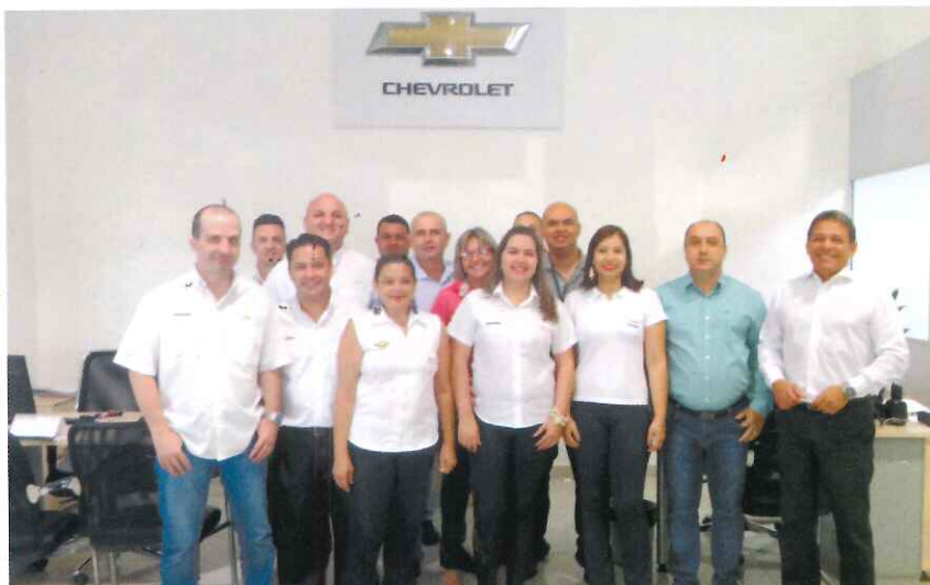
Equipe de vendas: prioridade é o cliente