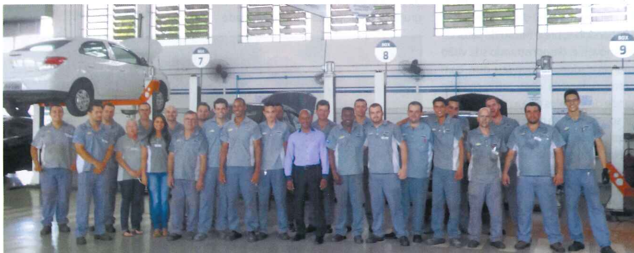
Equipe de profissionais da oficina

mos em contato depois para saber se foi bem atendido pelo técnico. Além disso, fazemos uma pesquisa de satisfação na compra do veículo. Neste