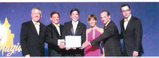
Diretoria recebe prêmio do Clube do Presidente, Classificação A

Chevrolet, portal disponibilizado pela GM onde eles recebem treinamentos, on-line ou presencial, além de conter vários boletins informativos sobre os produtos e os procedimentos.