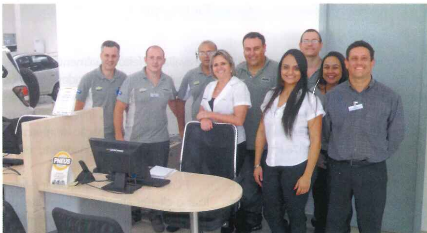
Equipe do pós-venda da Graciano Araraquara

mento Premium da Graciano Veículos o serviço de pesquisa de satisfação. "Quando nosso cliente traz seu veículo para nossas oficinas, entra-