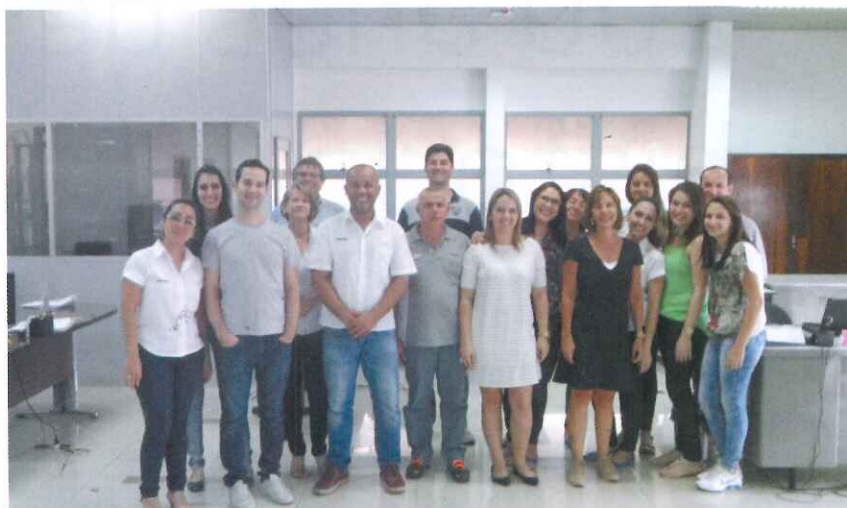
Equipe da Administração