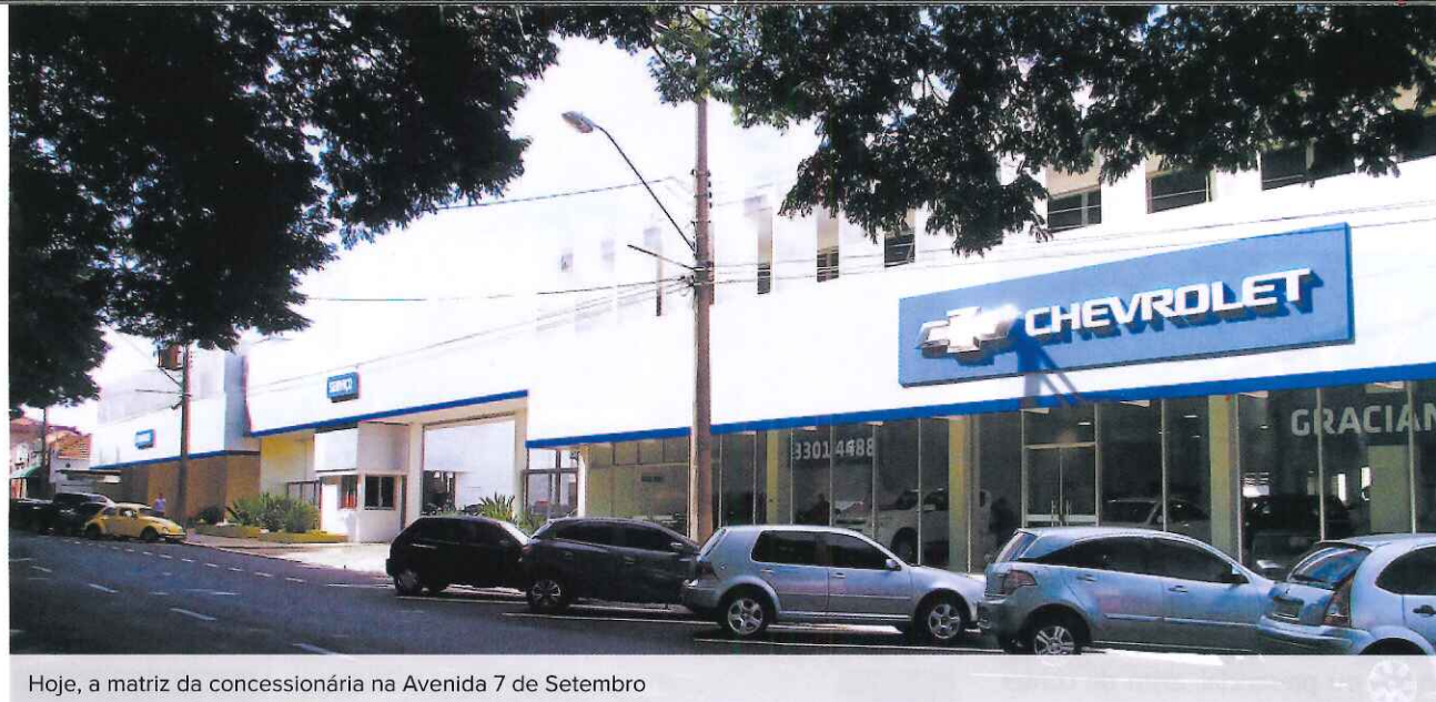
Hoje, a matriz da concessionária na Avenida 7 de Setembro

A concessionária Graciano Veículos nasceu em São José dos Campos (SP) e logo em seguida foi transferida para Araraquara, onde inicialmente foi instalada na Rua Carlos Gomes, na esquina da Avenida Brasil, e em 1978 foi transferida para a Avenida 7 de Setembro.