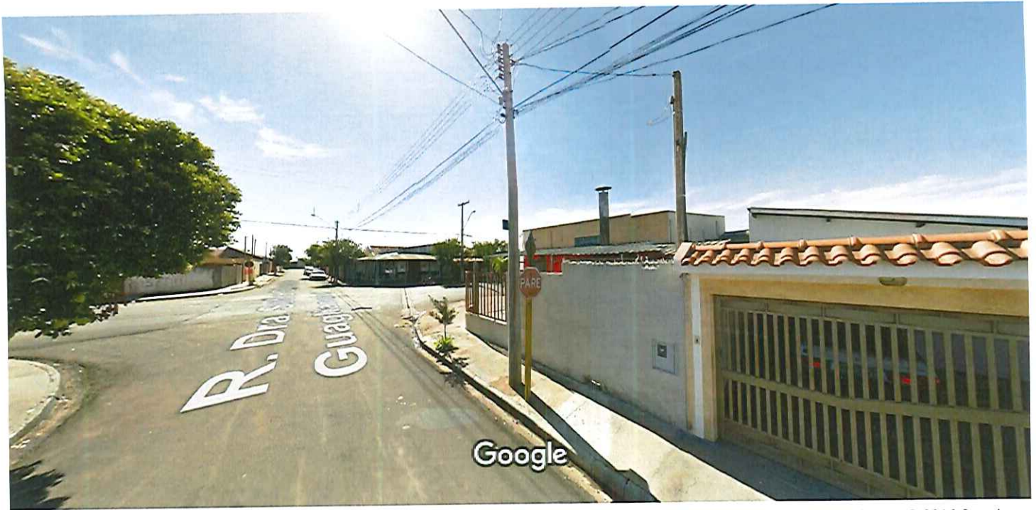
Captura da imagem: ago 2011