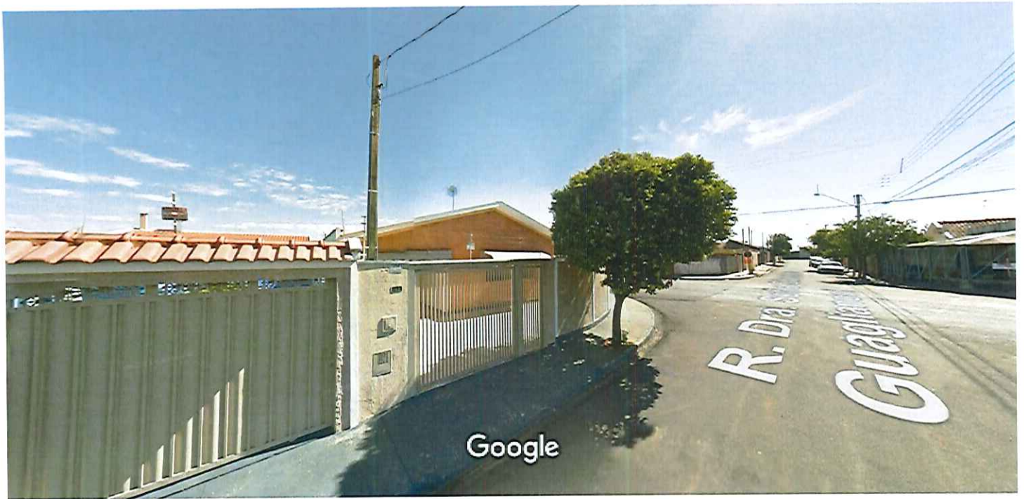
Captura da imagem: ago 2011