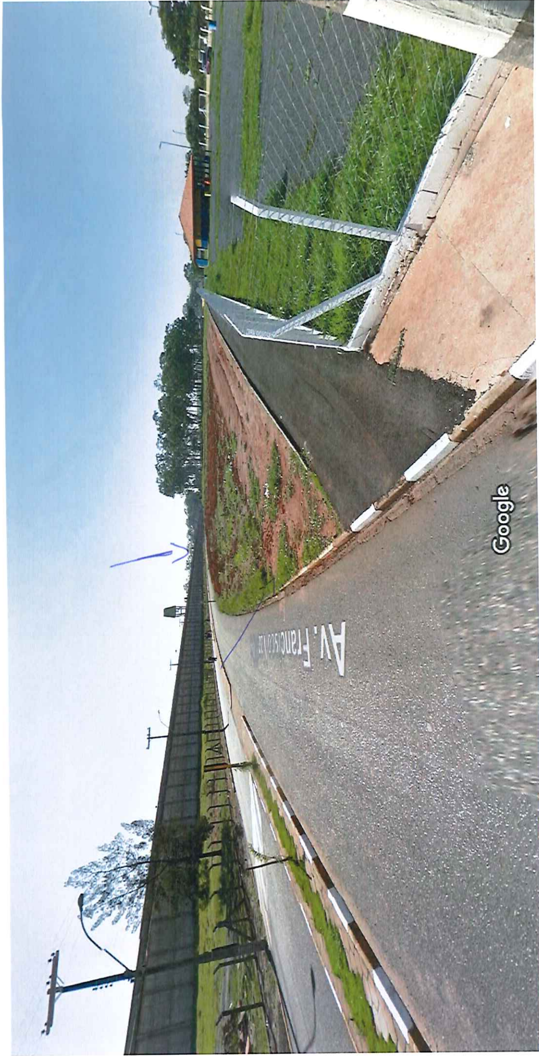
Captura da imagem: jun 2012