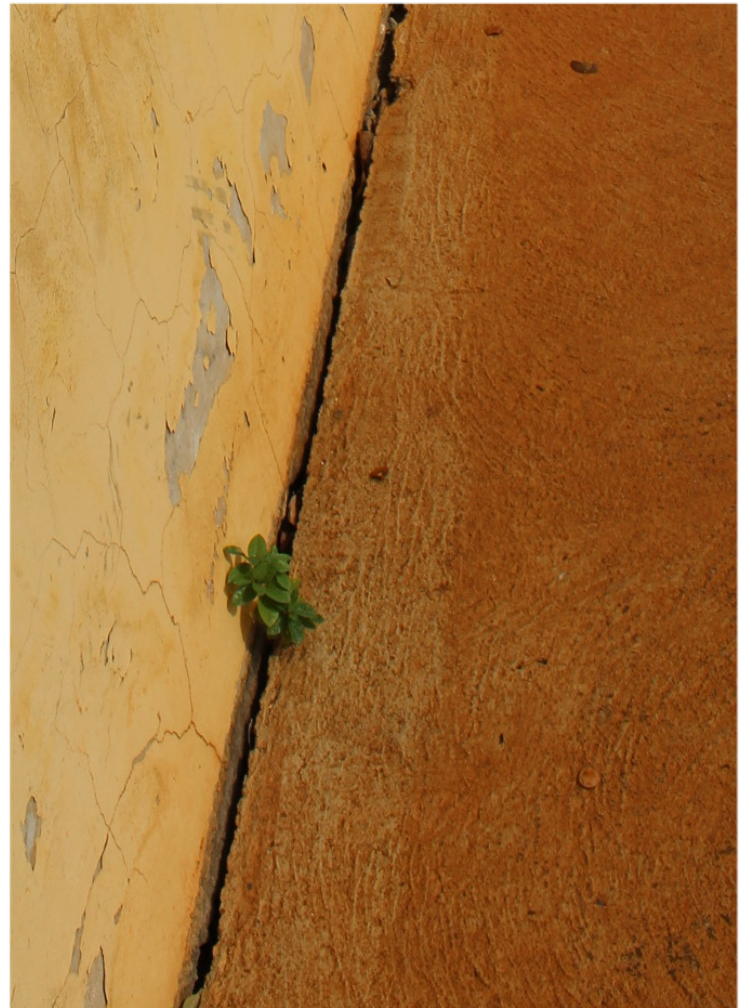
USF Dr Euclides Crocce - Vale do Sol