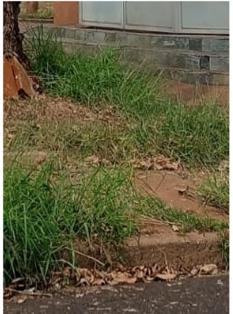
Rua Victor Lacorte