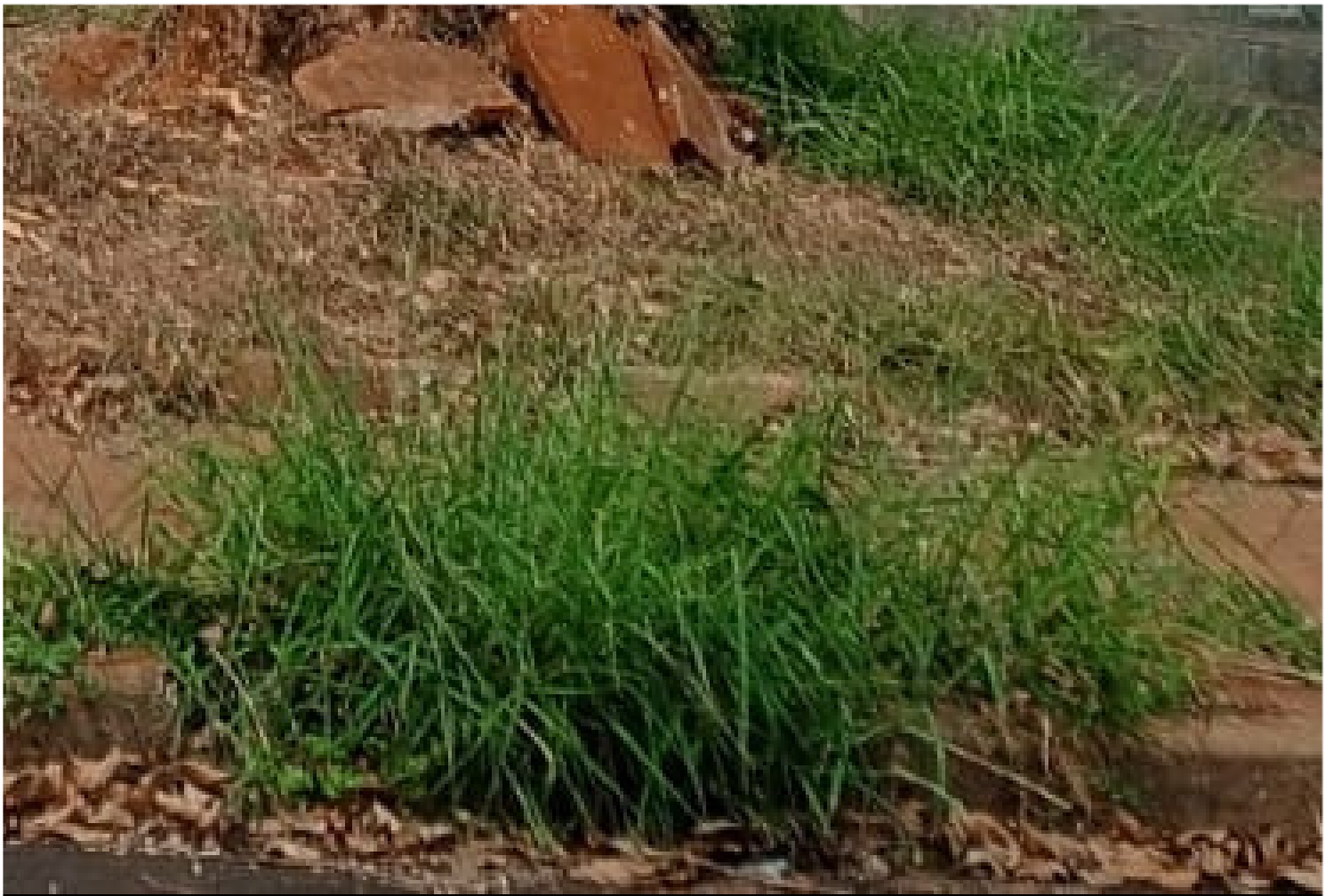
Rua Victor Lacorte