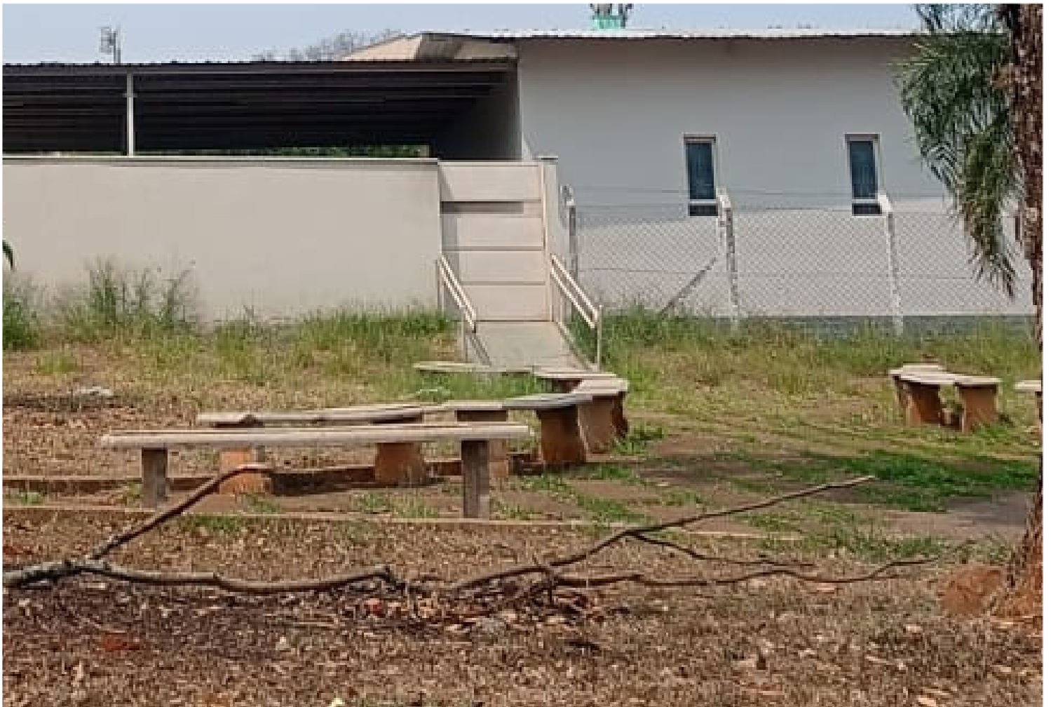
Rua Victor Lacorte