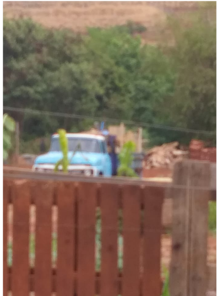
Rua Antônio Figueiredo Viana