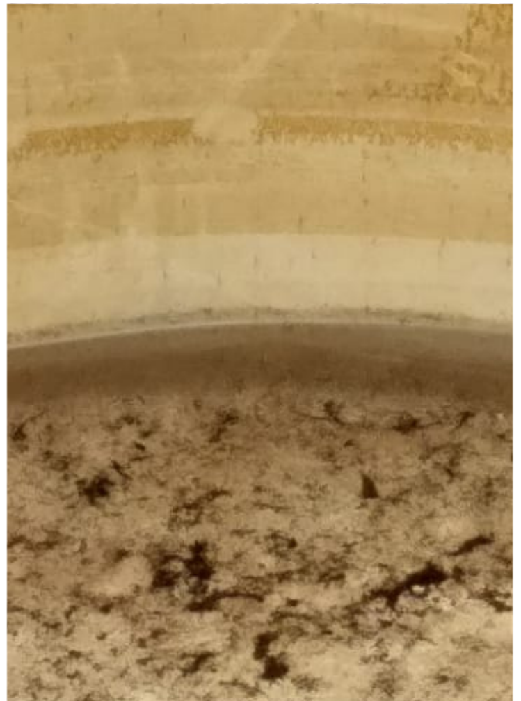
Rua Antônio Figueiredo Viana