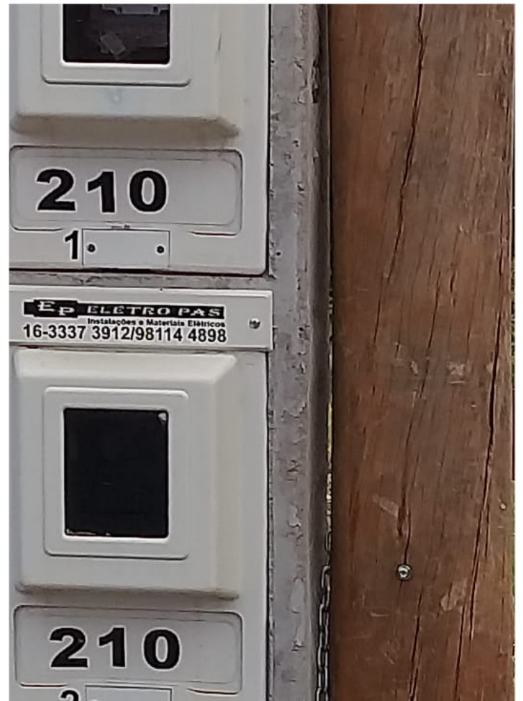
Rua Antônio Figueiredo Viana