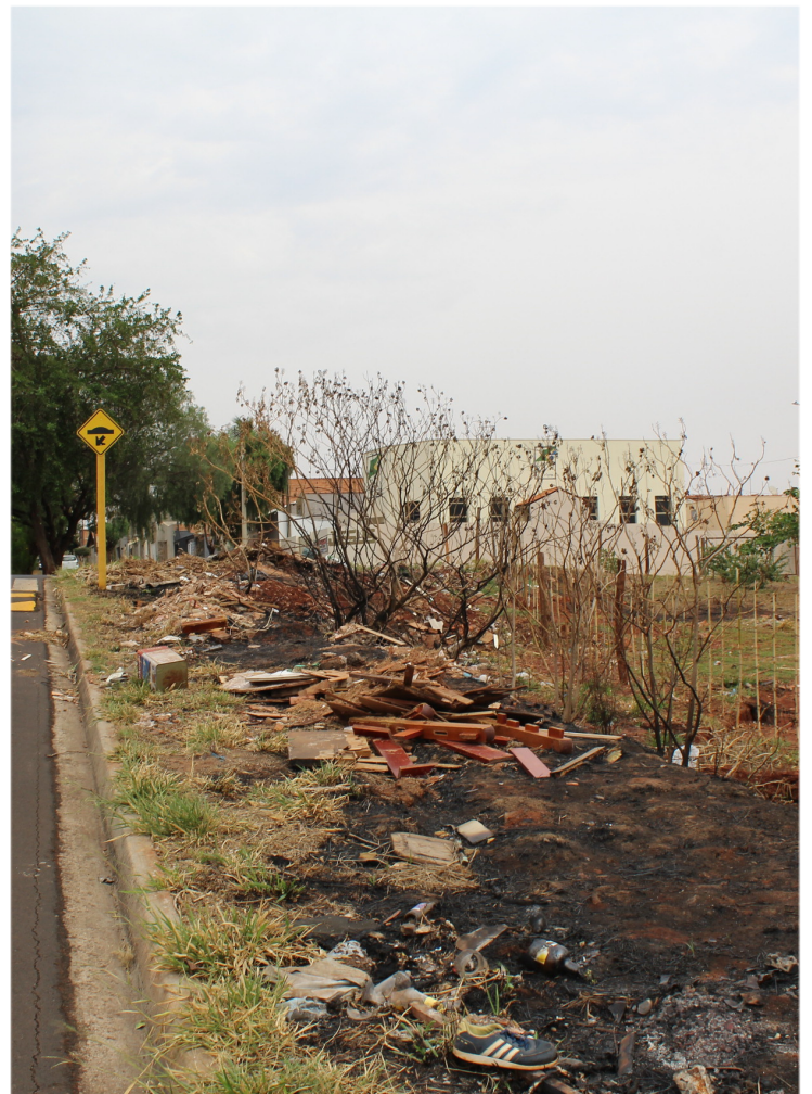
Av. Padre Miguel Pocce