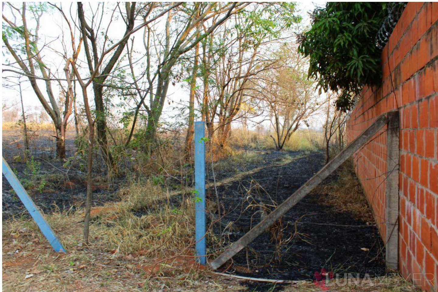
Entrada SE (Direto na Rua Brambilla Passos)