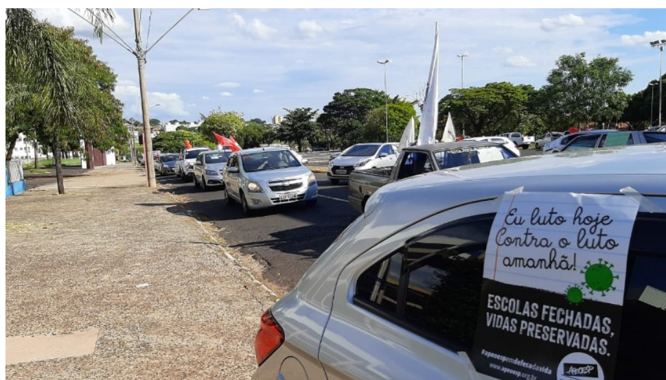
Carreata de professores e profissionais da educação pede o não retorno presencial das aulas em Araraquara

Segundo a secretaria, "boa parte foi positivada a partir de casos na própria família. É reconhecido pelas autoridades da saúde que as festas de fim de ano, seguidas de viagens de férias e reuniões familiares tiveram impacto significativo no aumento de casos positivados no município nas últimas semanas".