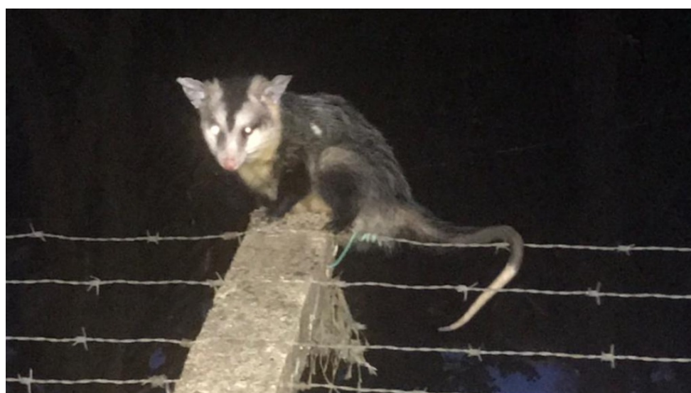
Gambás são vistos com frequência no Parque Infantil na pandemia

Diariamente, o funcionário público Cassiano Simões Ferreira, caminha pelo Parque Infantil e alimenta gatos que vivem no espaço verde da cidade.