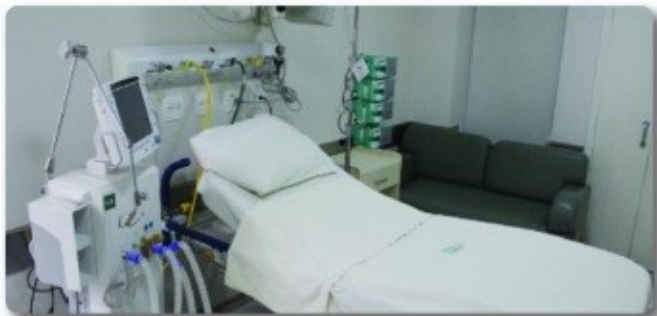
Hospital São Paulo - Unimed. Pag. 03