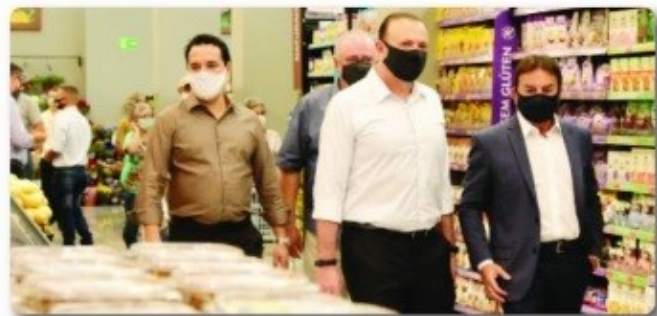
Savegnago abre 200 vagas na Vila Xavier. Pag. 03