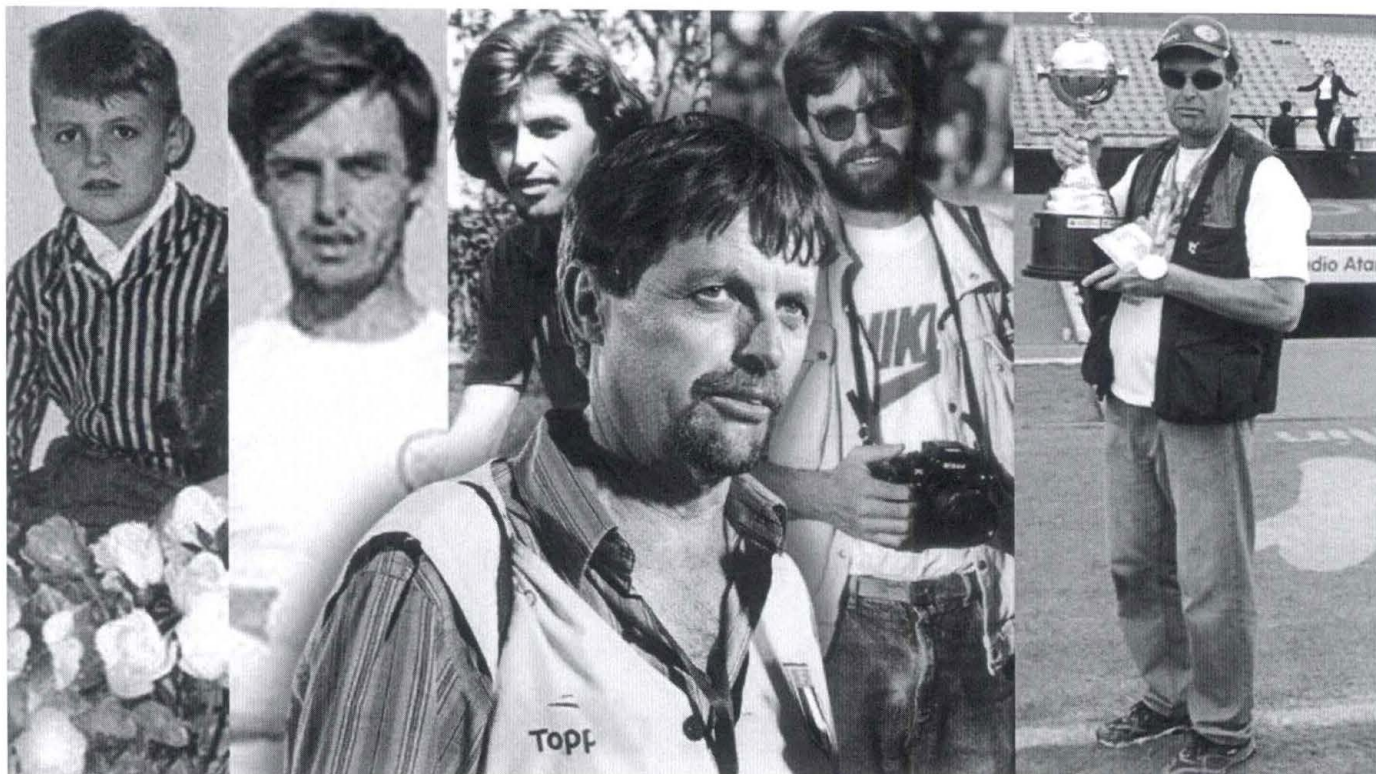
Tetê Viviani é uma referência do fotojornalismo.

text=https://www.portalmorada.com.br/esporte/esportes/76970/tete-viviani-e-a-arte-de-fotografar-a-historia)