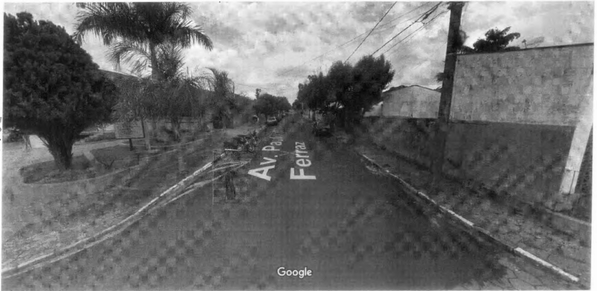
Captura da imagem: dez. 2017