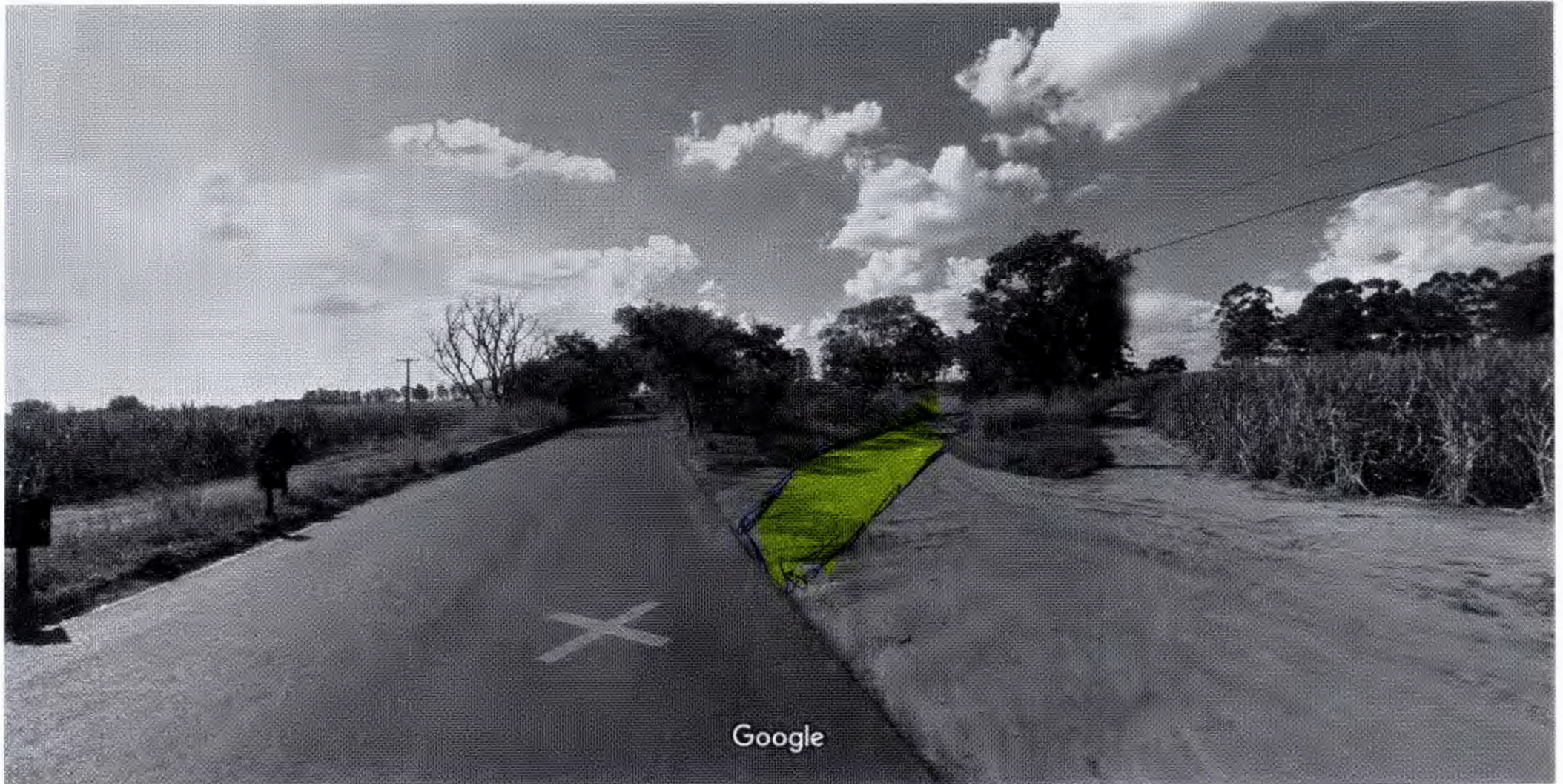
Captura da imagem: jun 2012