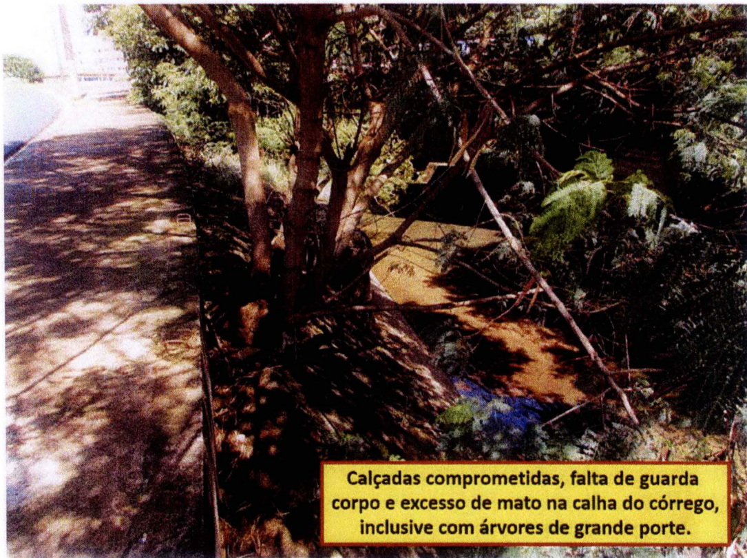
Calçadas comprometidas, falta de guarda corpo e excesso de mato na calha do córrego, inclusive com árvores de grande porte.