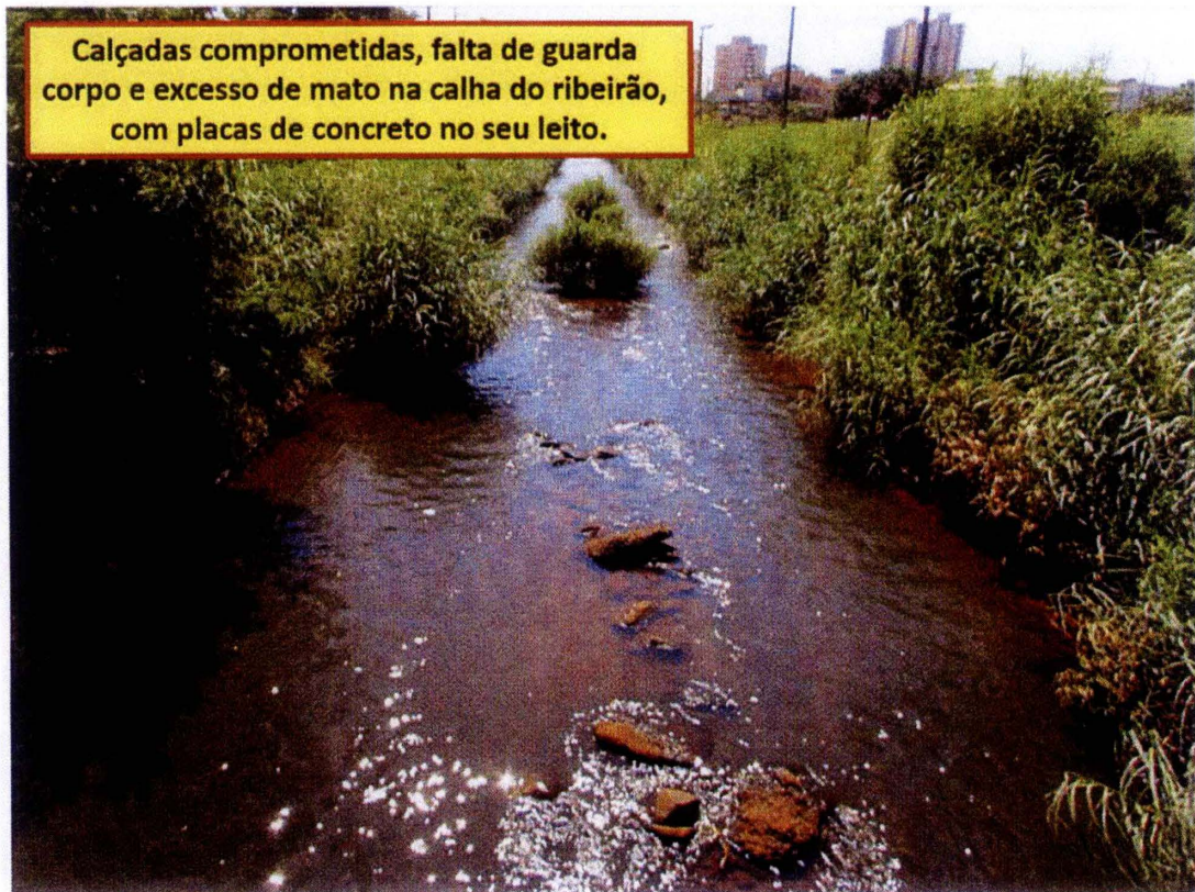
Calçadas comprometidas, falta de guarda corpo e excesso de mato na calha do ribeirão, com placas de concreto no seu leito.