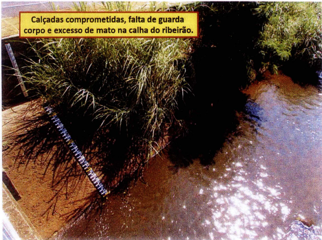
Calçadas comprometidas, falta de guarda corpo e excesso de mato na calha do ribeirão.