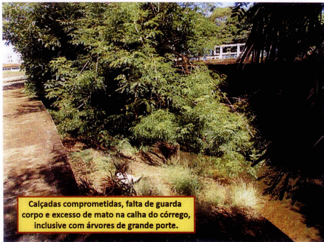
Calçadas comprometidas, falta de guarda corpo e excesso de mato na calha do córrego, inclusive com árvores de grande porte.