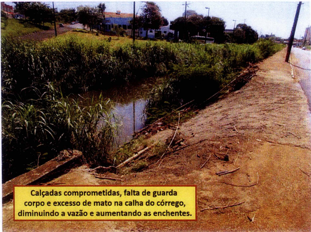
Calçadas comprometidas, falta de guarda corpo e excesso de mato na calha do córrego, diminuindo a vazão e aumentando as enchentes.