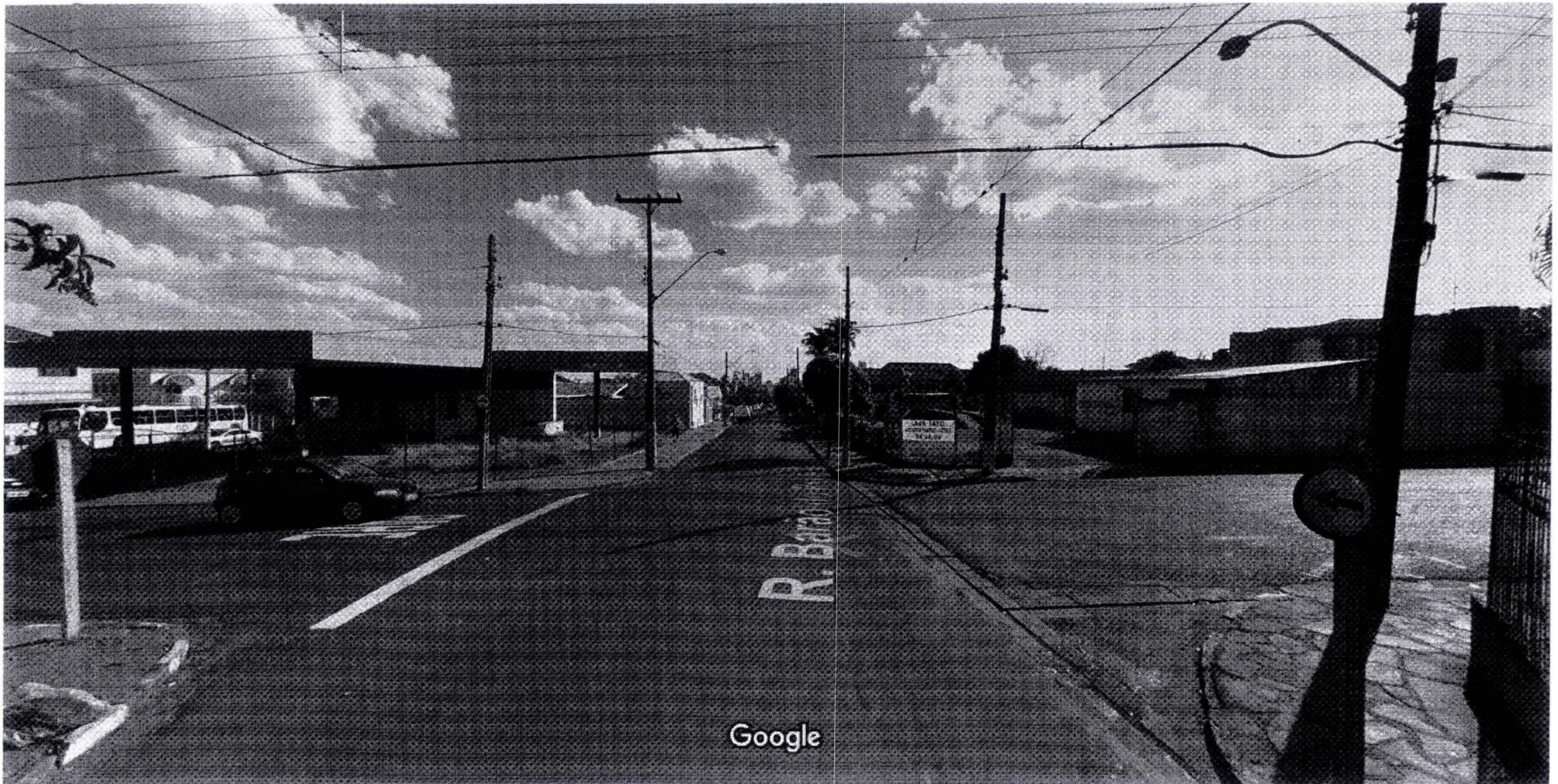
Captura da imagem: ago 2011