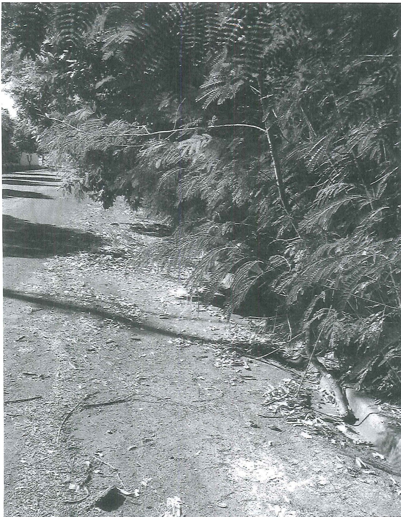
Indicação 004 - 02 - Abandono Cepar