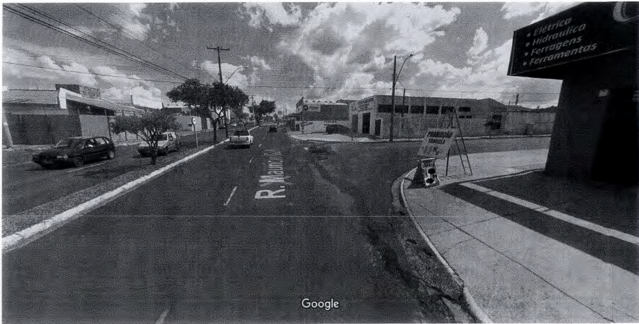
Captura da imagem: dez 2017