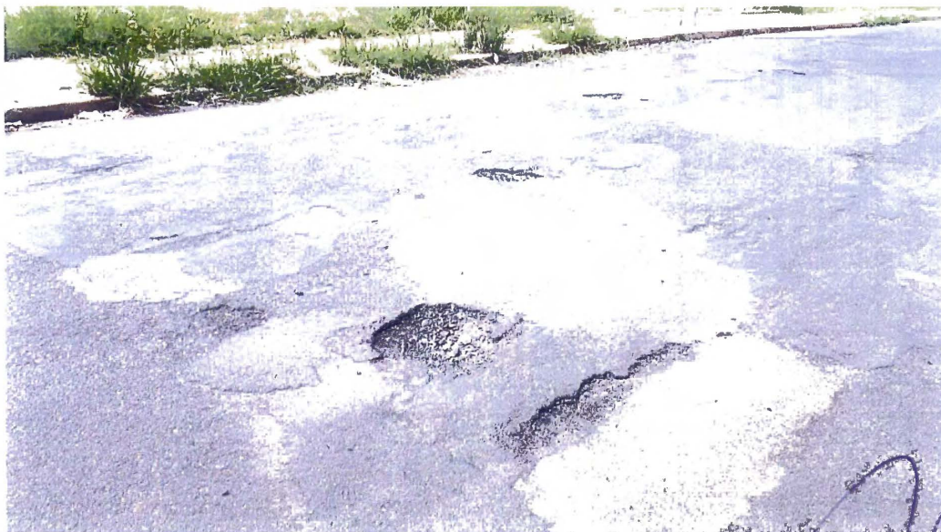
Tapa Buraco - Av. Prof. Eugênio Francisco Malaman