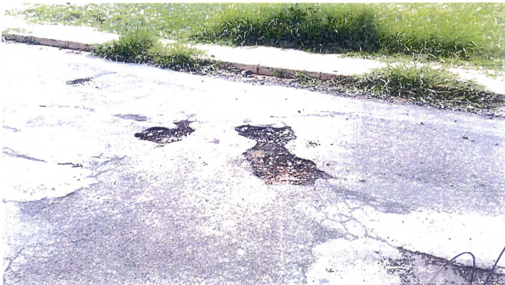
Tapa Buraco - Av. Prof. Eugênio Francisco Malaman