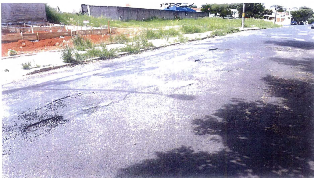
Tapa Buraco - Av. Prof. Eugênio Francisco Malaman