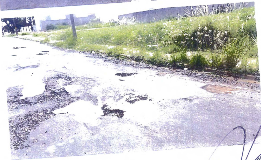
Tapa Buraco - Av. Prof. Eugênio Francisco Malaman