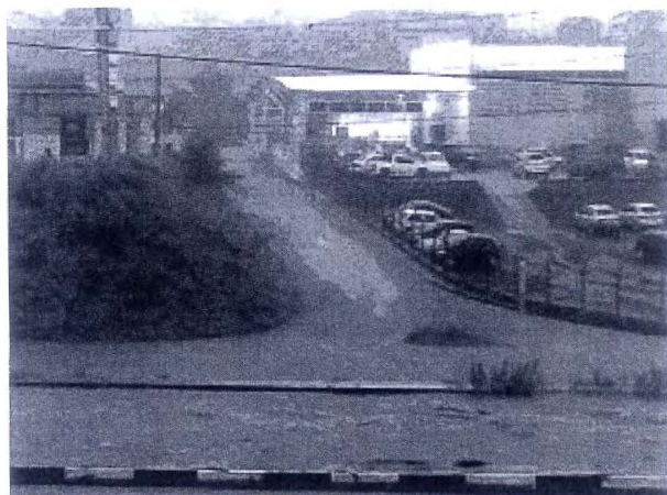
Nível do Rio do Ouro subiu rapidamente e alagou Via Expressa

Bombeiros de Araraquara, no interior de São Paulo, retomaram na manhã desta segunda-feira (13) as buscas pela mulher idosa que desapareceu após as chuvas que atingiram a cidade na tarde do último sábado (11).