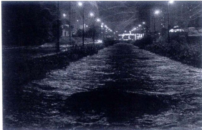
Correnteza do córrego ficou 'forte' durante horas

A forte chuva que caiu em Araraquara alagou várias ruas e avenidas. A Via Expressa é um dos pontos mais críticos, com alagamentos constantes.