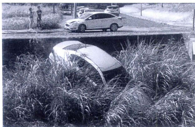
O carro caiu na margem do rio

A Pol6cia Militar registrou o caso. O carro dever6 ser retirado do rio ainda na manh6 desta sexta-feira e talvez seja necess6ria a interdi76o parcial da Via Expressa para o trabalho.