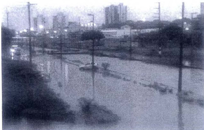
Carro fica escorado em poste e quase cai em córrego na Expressa de Araraquara (Colaboração)

Um Gol prata quase caiu no Córrego da Estação D´Ouro, na avenida Maria Antônia Camargo de Oliveira (Via Expressa), próximo a Rodoviária de Araraquara. Isso porque, com a forte chuva que cai na cidade desde às 17 horas, a água transbordou. O Corpo de Bombeiros foi acionado para tirar o veículo do local, um bote teve que ser utilizado.