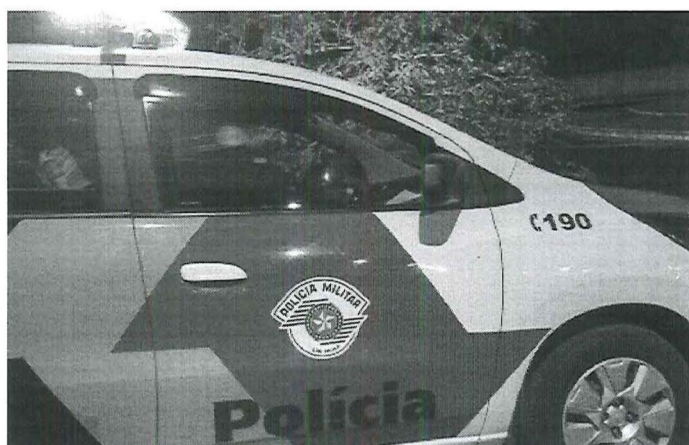
Jovens abandonaram a droga no momento da abordagem policial

Policiais militares prenderam um menor de idade e um homem de 25 anos por tráfico de drogas na manhã deste domingo (22), no Vale Verde, na rua Tereza Pelegrineti Mota. Eles estavam em atitudes suspeitas manuseando um saco plástico, que foi abandonado no local no momento da abordagem policial.