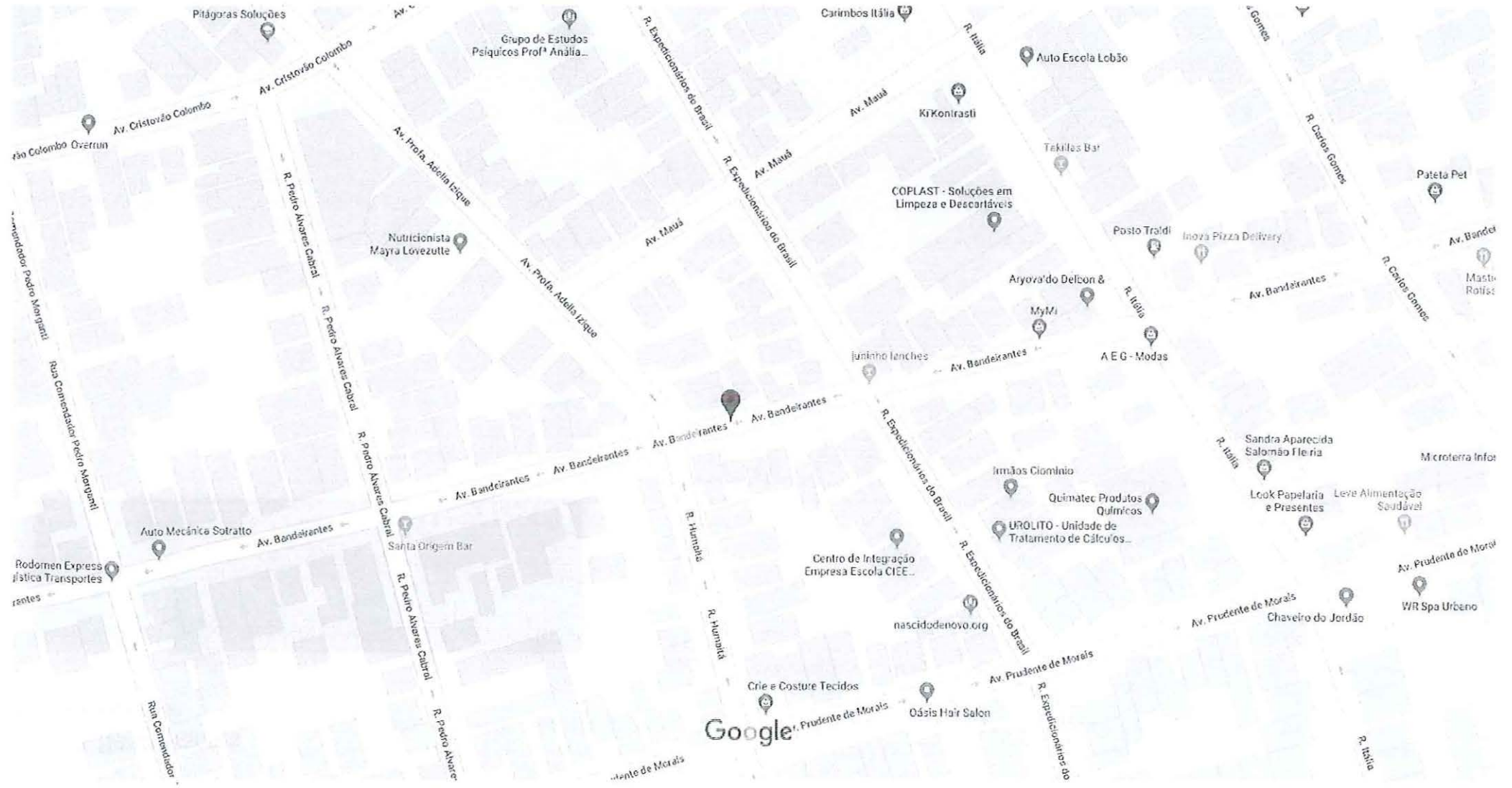
Dados do mapa ©2018 Google 20 m