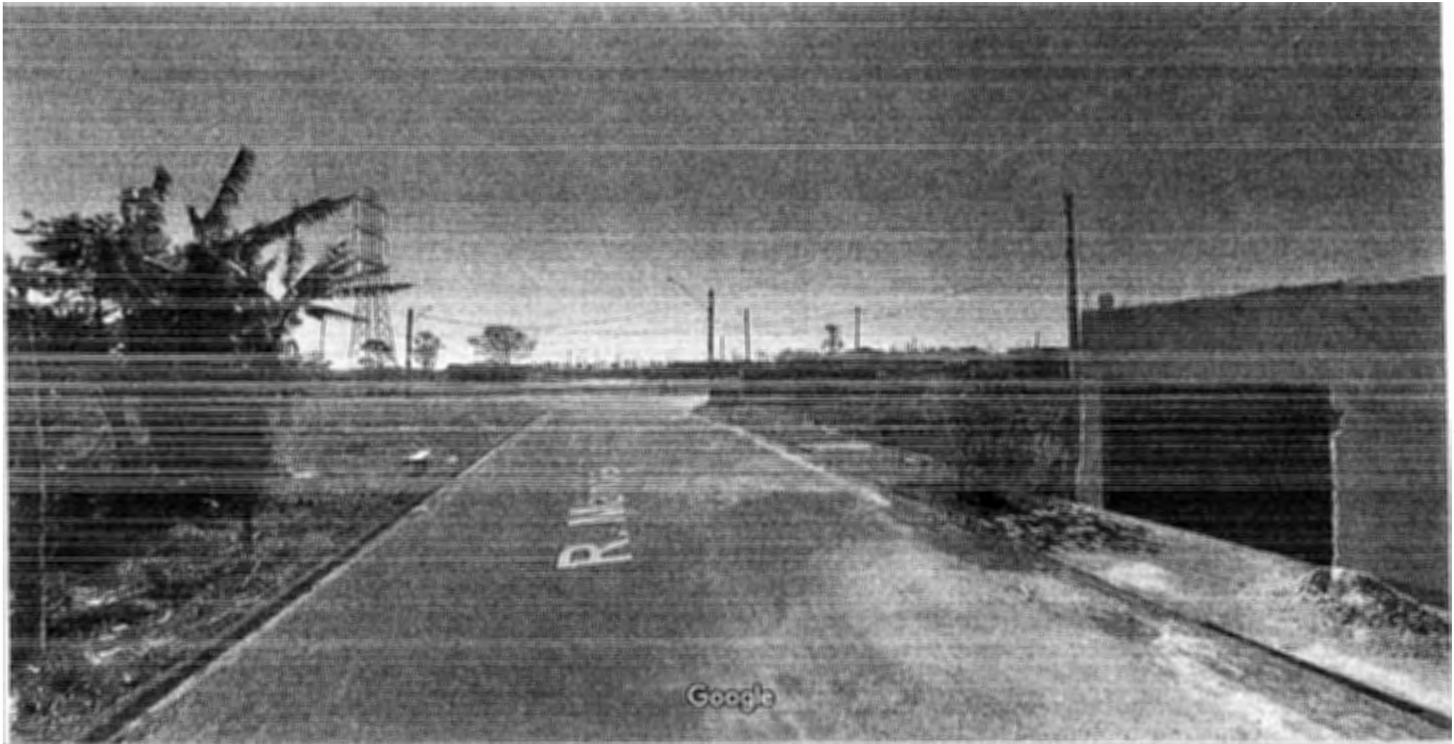
Captura da imagem: ago 2011