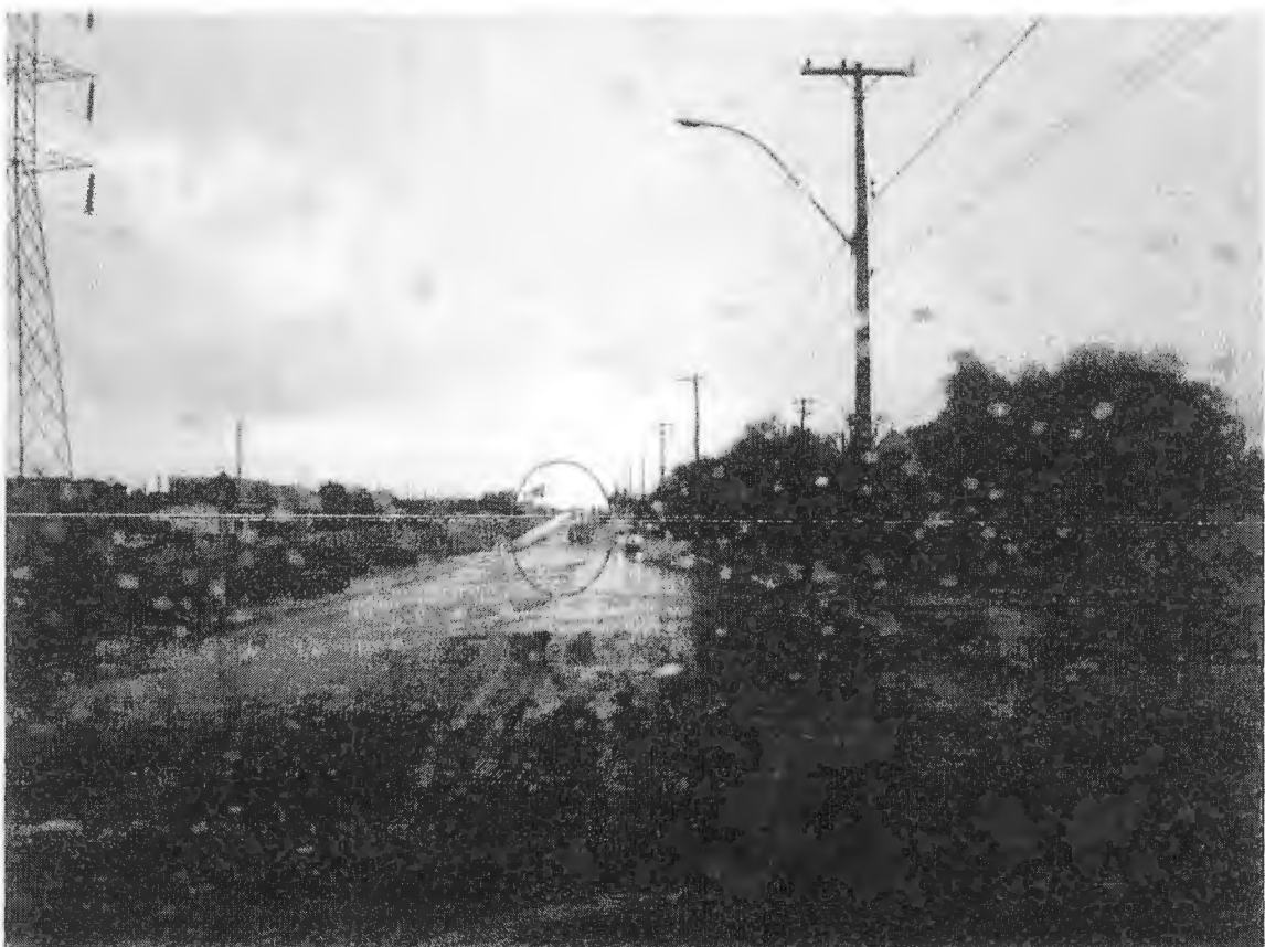
Na imagem mostra o carro na via oposta desviando do alagamento.