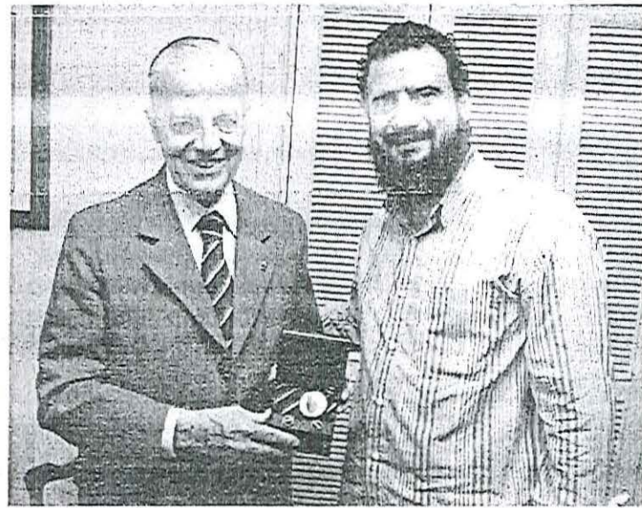
Historiador em visita a Casa Imperial do Brasil