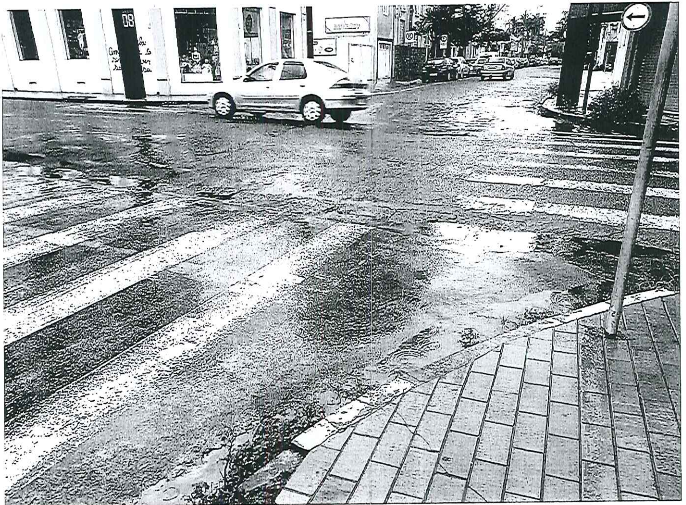
Ind. 005-6 Manutenção Do Asfalto Da Rua Carlos Gomes Com A Rua José Bonifacio