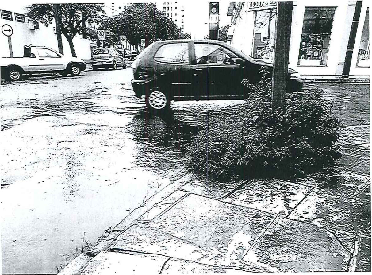
Ind. 005-6 Manutenção Do Asfalto Da Rua Carlos Gomes Com A Rua José Bonifacio