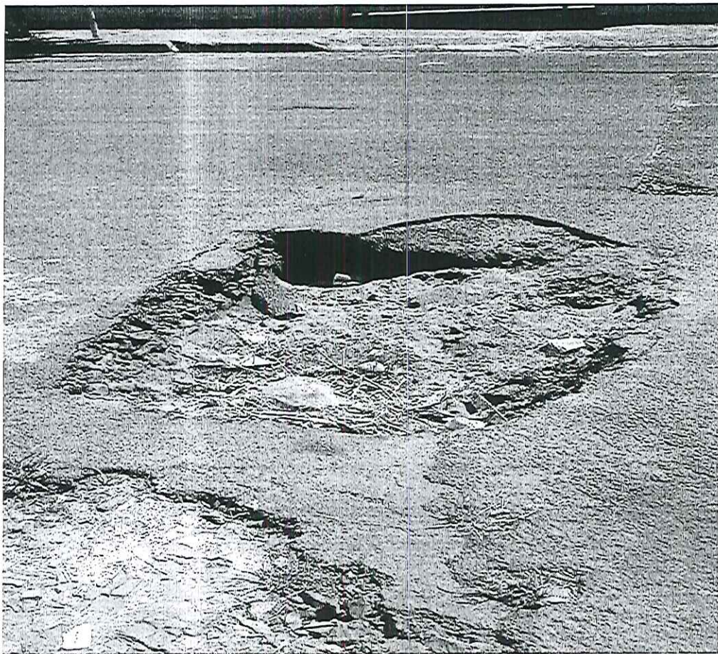
1 - 25.04 – Tapa buraco - Avenida Pedro Grecco, altura n. 247 - Pq. das Hortências