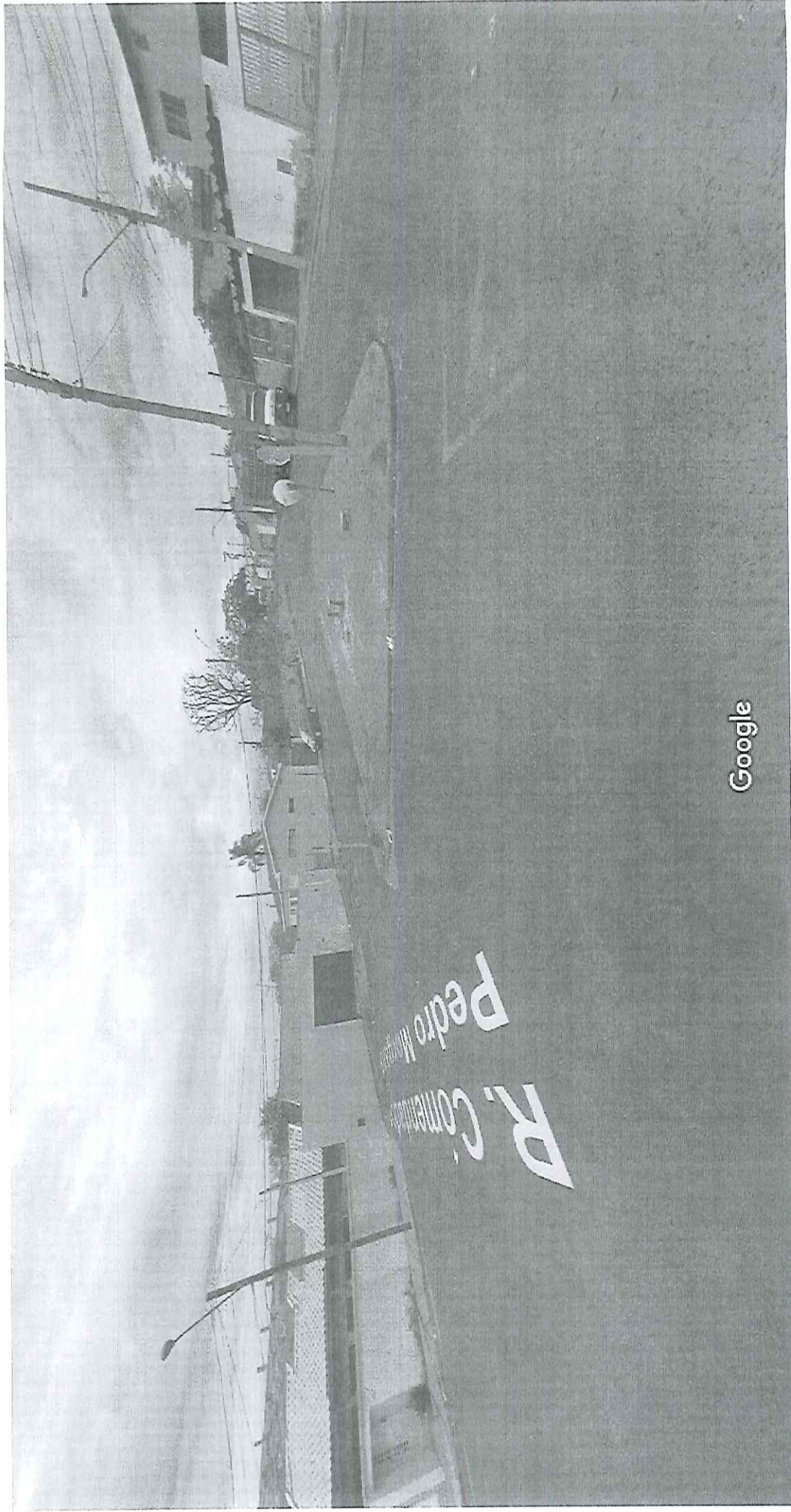
Captura da imagem: ago 2011

Araraquara, São Paulo Street View - ago 2011