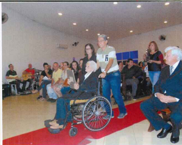
Moradora e funcionários do Lar participam da celebração