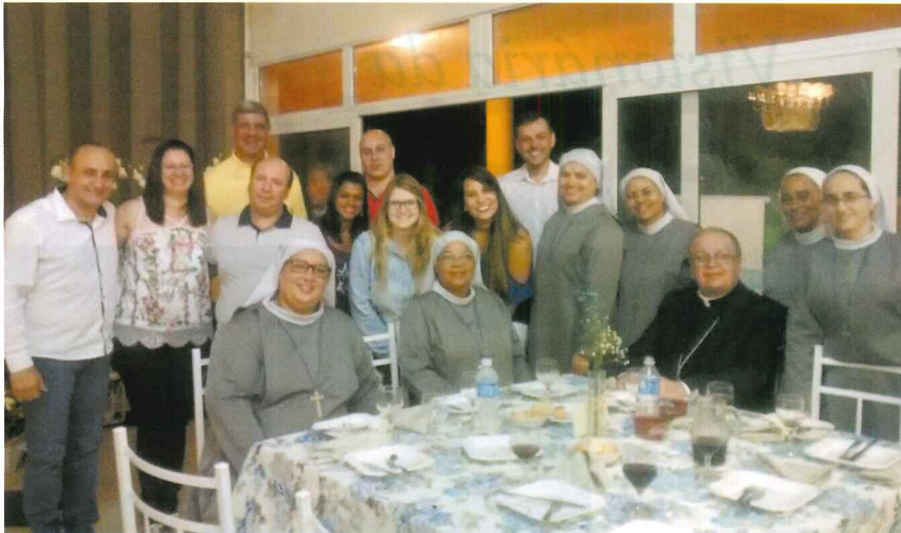
Grupo de funcionários e voluntários reunidos na festa de 100 anos

para modernas instalações físicas e com total acessibilidade adequada ao atendimento dos idosos, em um prédio localizado no bairro do Carmo. Na nova sede, o asilo passou a ser denominado Lar São Francisco de Assis.