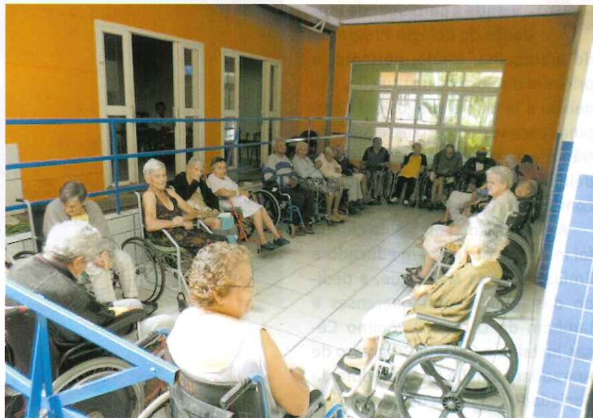
São 140 idosos residindo hoje no Lar