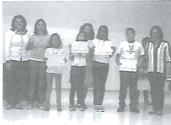
Premiação aos alunos da E E Francisco Pedro Monteiro da Silva

As Emefs Waldemar Saffiotti, Rafael de Medina, Ruth Cardoso e Ricardo Caramuru também foram medalhistas.