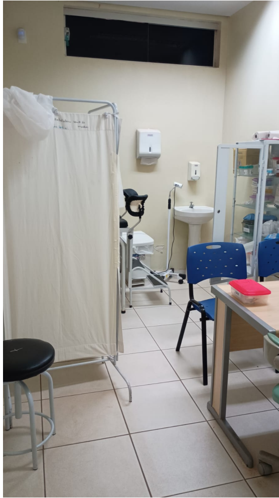
Falta banheiro nos consultórios.