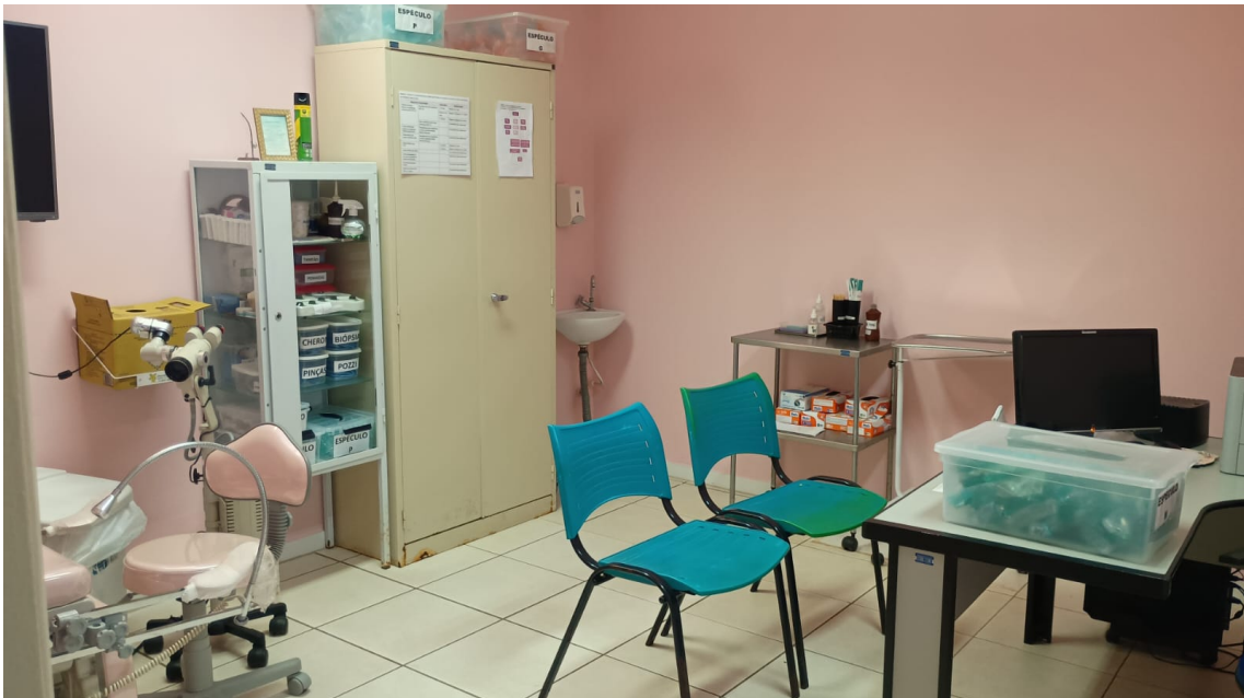
Falta banheiro nos consultórios.