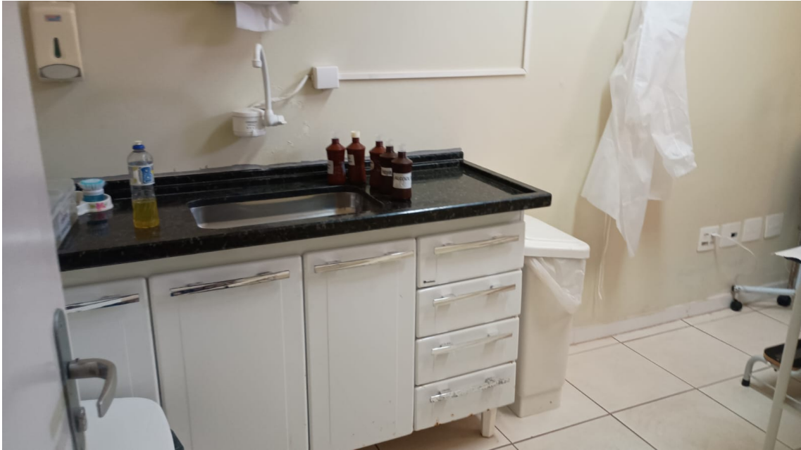
Pia para a higienização das mãos e está sendo usada para a lavagem dos objetos usados em consultas.