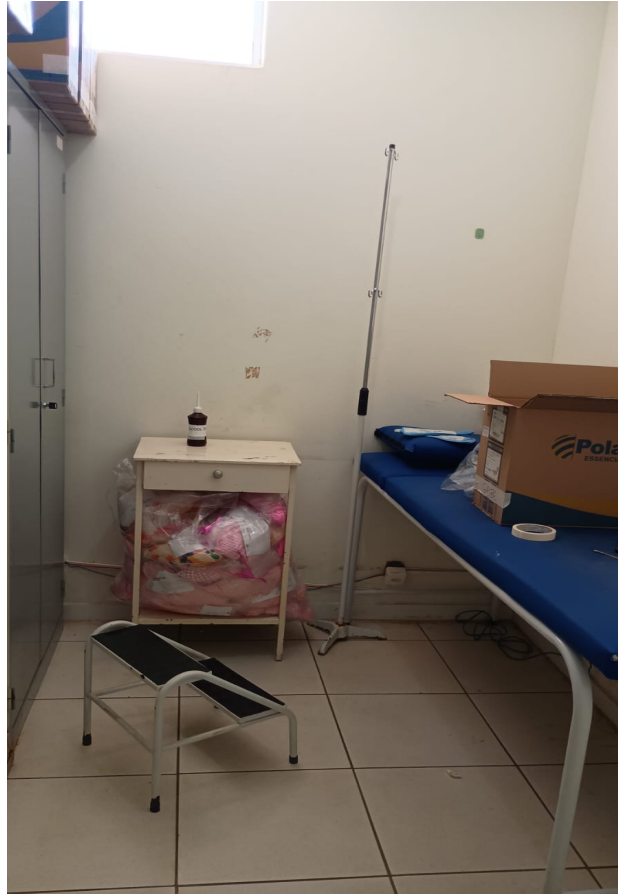
Sala eletrocardiograma, não tem ele eletrocardiograma, está quebrado.