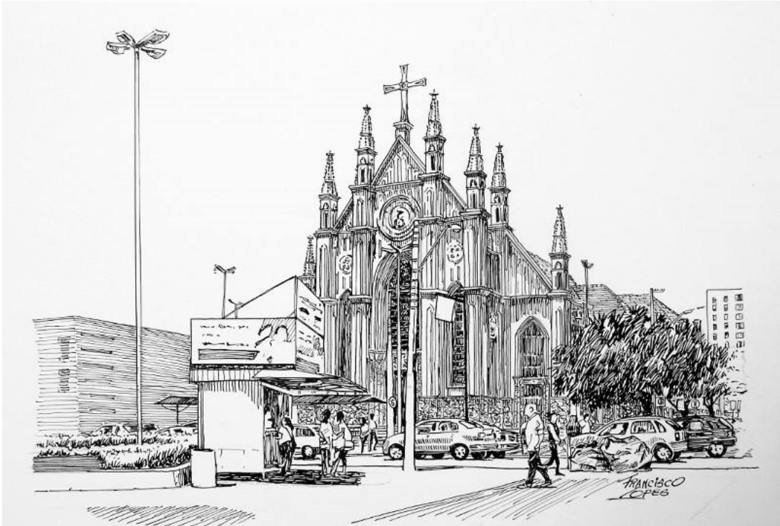
Igreja de Santa Cruz