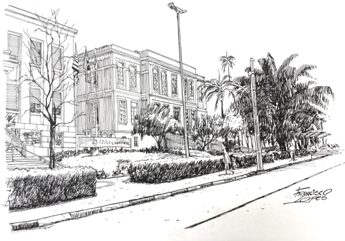
Casa da Cultura e uma parte da sede da Câmara Municipal de Araraquara