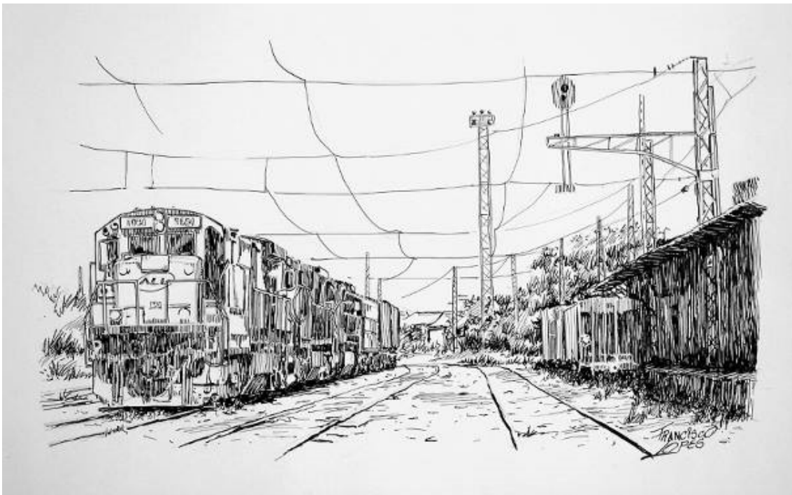
Da série “Trilhos”