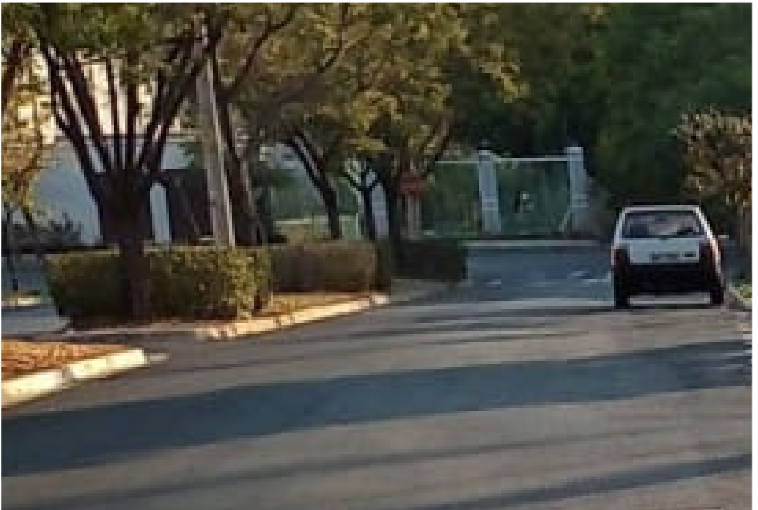
Jardim das Flores