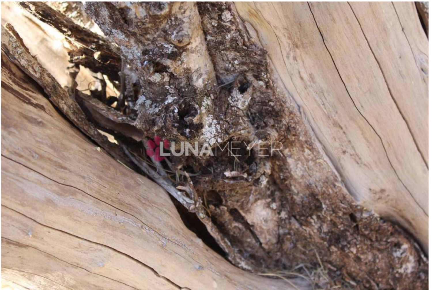
20/08 - Visita ao distrito de Bueno de Andrada