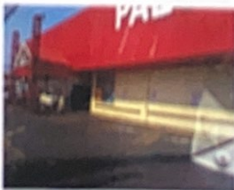
Av. Francisco Vaz Filho, 2864