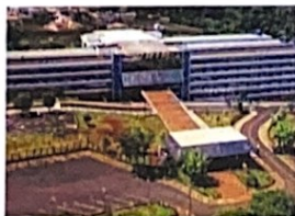
Faculdade Unip - Av. Alberto Benassi