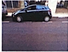
Av. Osório, 112

Associação Paulista referência Banco Itau