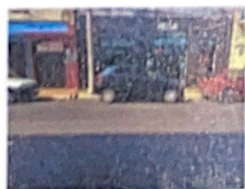
Rua São Bento, 1128