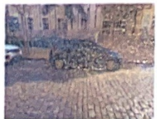
Rua Voluntários da Pátria, 2080

Associação Paulista referência Banco Itau