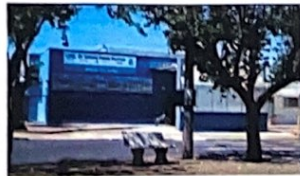
Unidade de Pronto Atendimento - UPA Vila Xavier