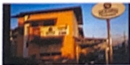
Av. Alberto Santos Dumont, 686