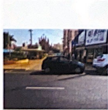
Rua Nove de Julho, 1068