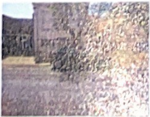
Av. José Bonifácio, 819

Associação Paulista referência Banco Itau