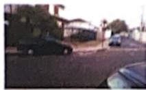
Hospital São Paulo - 24hrs