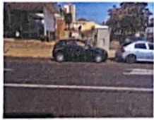
Av. Barroso 882

Associação Paulista referência Banco Itau