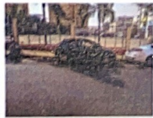
Av. Espanha 323