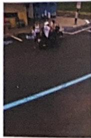
Unidade de Pronto Atendimento - UPA Central