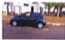
Rua José Parisi, 331