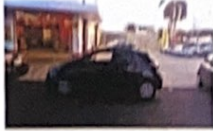
Av. Bento de Abreu, 442