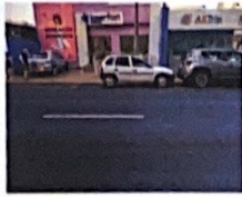
Rua São Bento, 1969