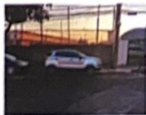
Hospital São Paulo - Saída de funcionários