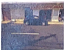
Rua São Bento, 939