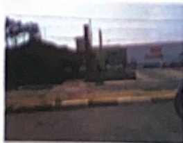
Av. Francisco Vaz Filho, 1919