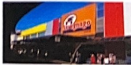
Rua Mauricio Galli, 555