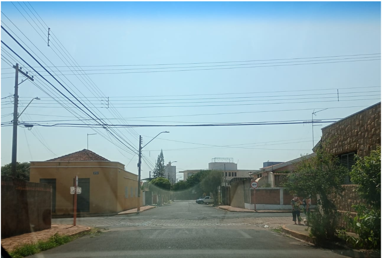
Rua Comendador Pedro Morgantti