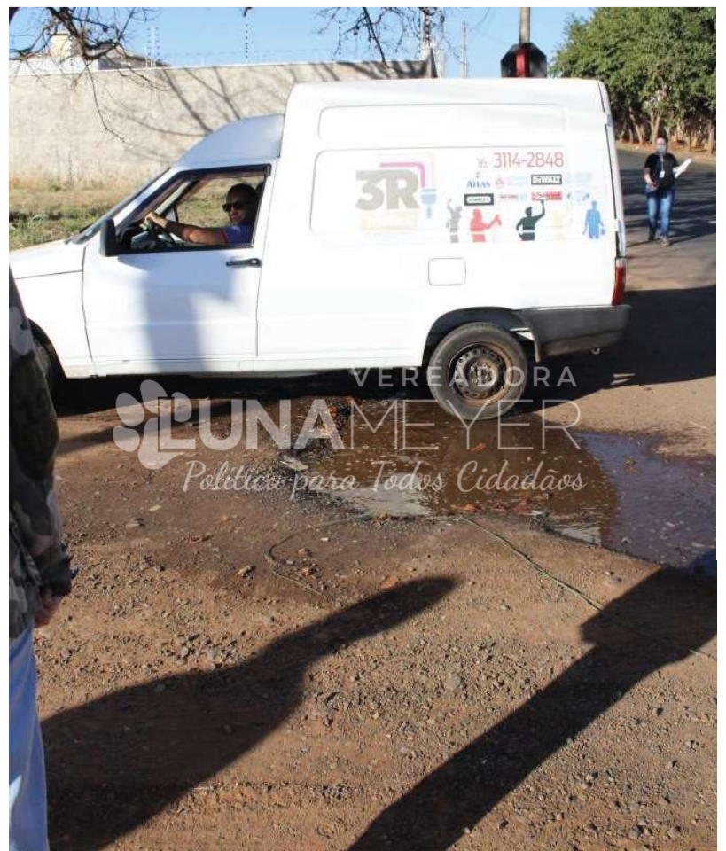
VISITA AO BAIRRO CIDADE JARDIM - 23/07/2022