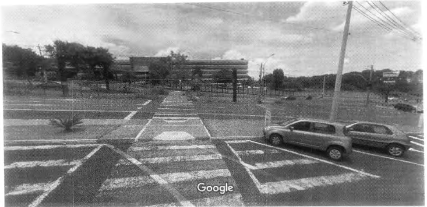
Captura de imagem: dez. 2017 © 2020 Google

que seja feito uma lombofaixa substituindo as faixas de pedestres em frente a esta faculdade, por ser uma via de grande fluxo de veiculos e transitarem muitos pedestres pelo local.