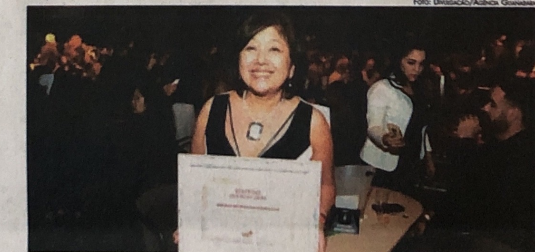
A araraquarense foi eleita a melhor dentista do mundo no evento Sorriso do Bem

Para selecionar o "Melhor Dentista do Mundo", são analisadas quantidade de atendimentos, a ampliação do número de beneficiários, a construção de políticas públicas junto às prefeituras, a divulgação da causa na imprensa e a captação de recursos e voluntários para o programa. Os voluntários enviam, previamente, um relatório à organização em que contam todas as atividades realizadas durante o ano. As informações são confrontadas com o banco de dados interno e os escolhidos são os que apresentam os melhores resultados objetivos e subjetivos. Depois, os trabalhos dos finalistas são levados ainda até um júri externo, composto por diferentes membros da sociedade civil, como professores, assistentes sociais e jornalistas, que avaliam os resultados de forma independente.