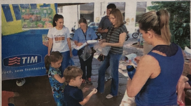
Uma nova edição do projeto acontecerá em janeiro

A pedido de pais de crianças, uma nova edição do projeto acontecerá em janeiro, no período de férias escolares, em data a ser divulgada.