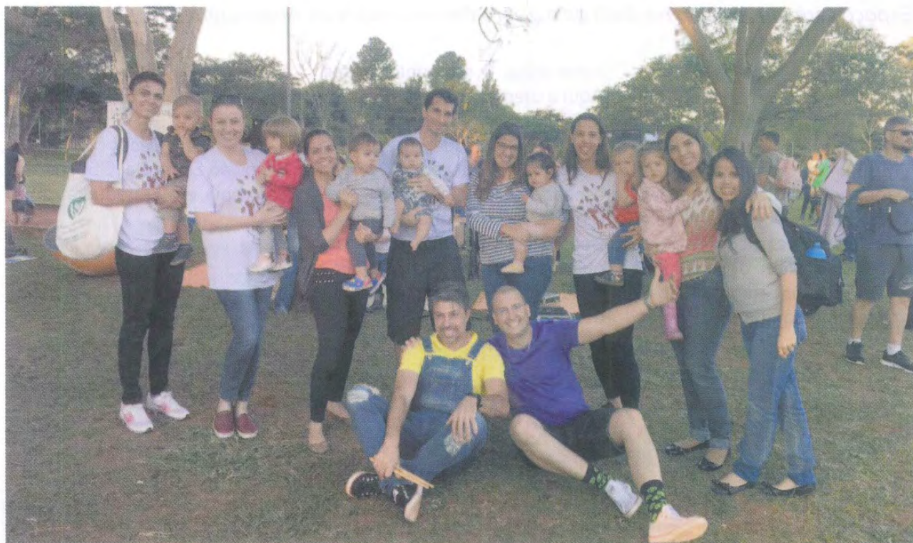
Equipe de voluntários do Projeto Parque Vivo com suas famílias no Parque do Jardim Botânico

CRIADO POR VOLUNTÁRIOS, PARQUE VIVO PROMOVE DIVERSAS ATIVIDADES PARA A FAMÍLIA AOS FINAIS DE SEMANA