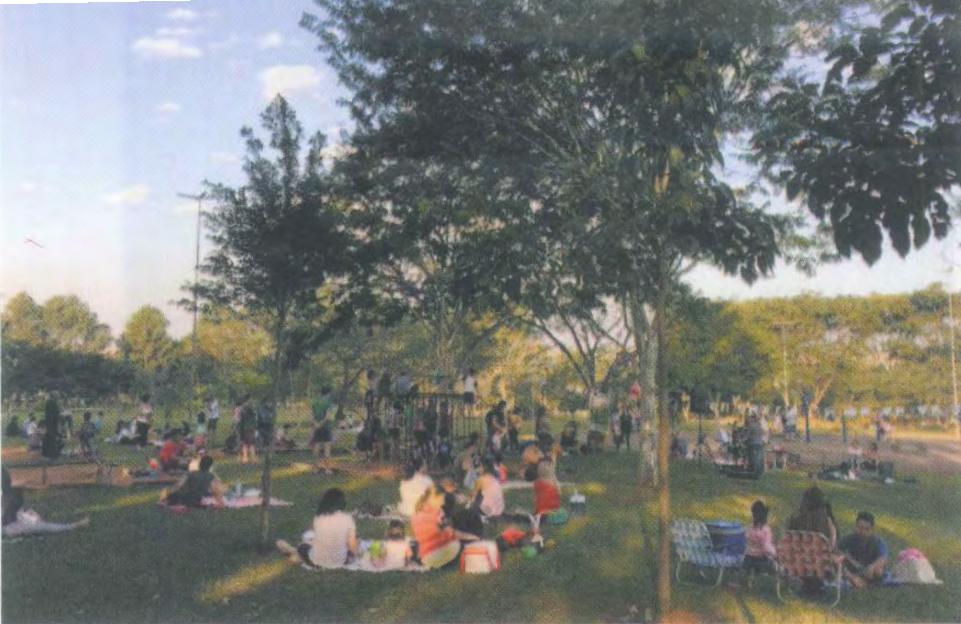
Projeto realiza atividades para todas as idades no Parque do Jardim Botânico

O Parque Vivo pretende tornar-se uma associação que trabalhe na transformação dos espaços em ambientes mais convidativos, dinâmicos e familiares. Pretende ainda garantir a preservação ambiental, segurança, manutenção e infraestrutura inclusiva, com soluções simples, econômicas, sustentáveis e atuais, além de promover uma agenda mensal no local com cultura, empreendedorismo criativo, esporte e lazer para a população de todas as idades.