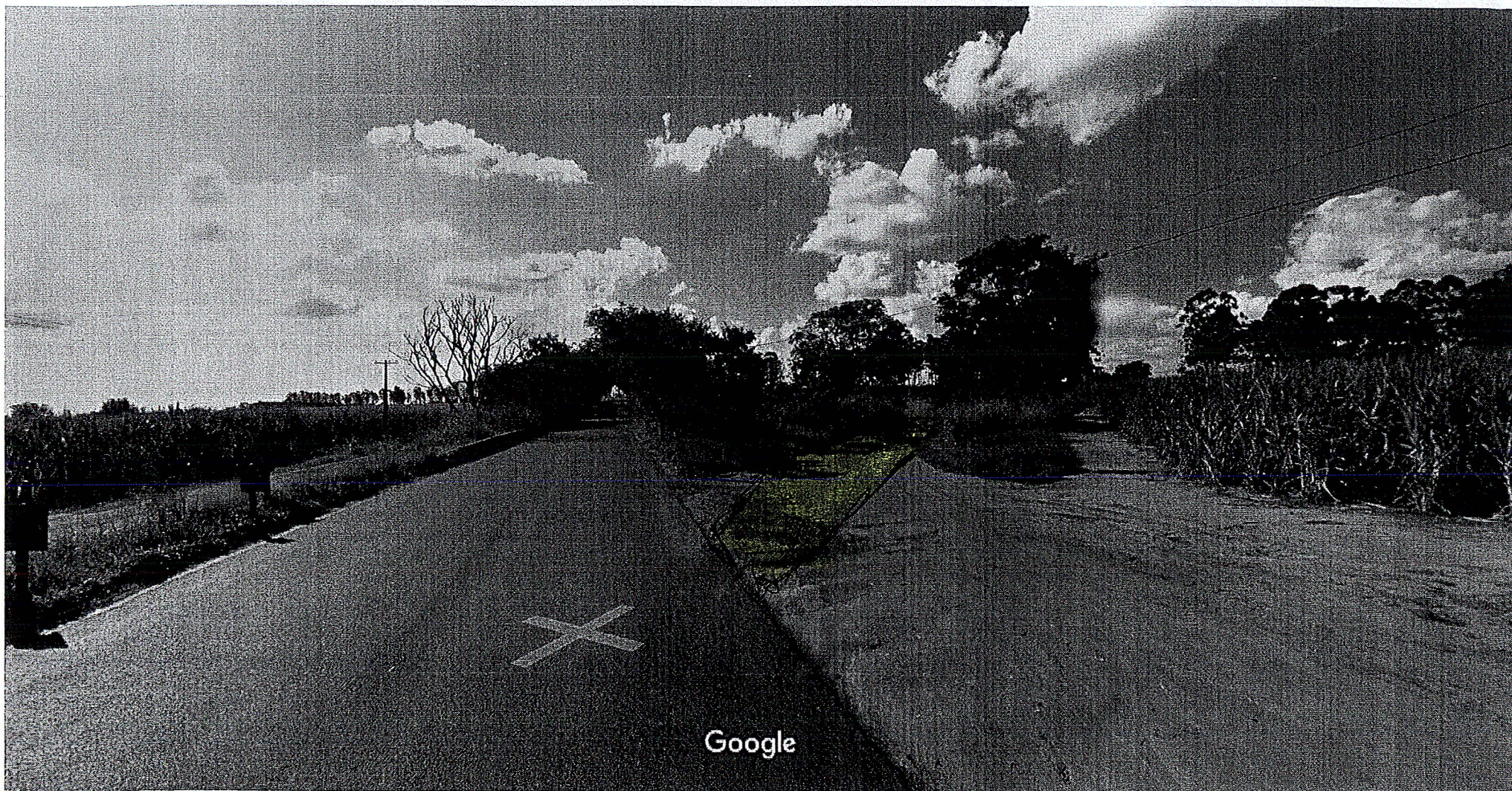
Captura da imagem: jun 2012