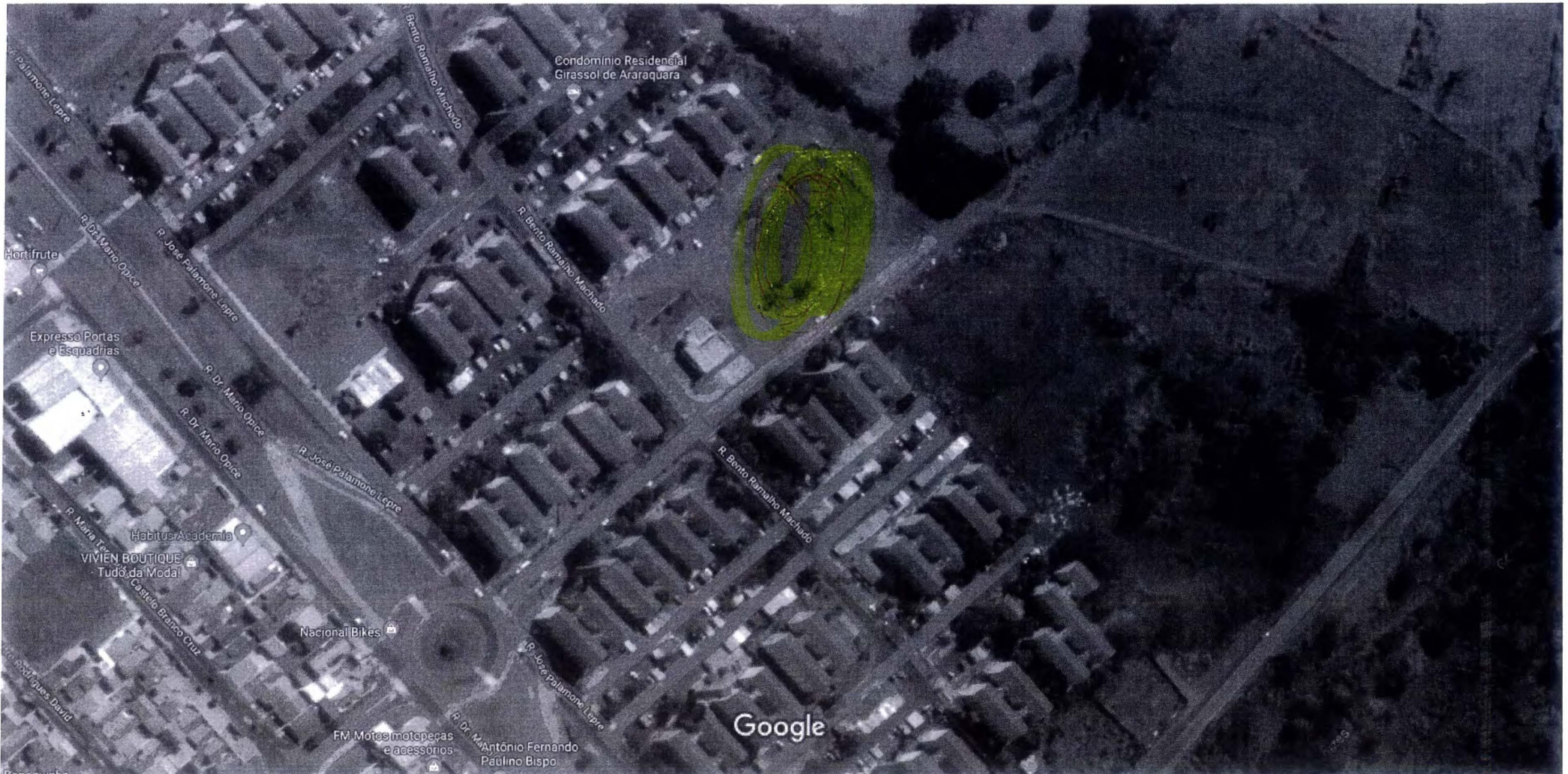
Imagens ©2019 DigitalGlobe, Dados do mapa ©2019 Google 20 m