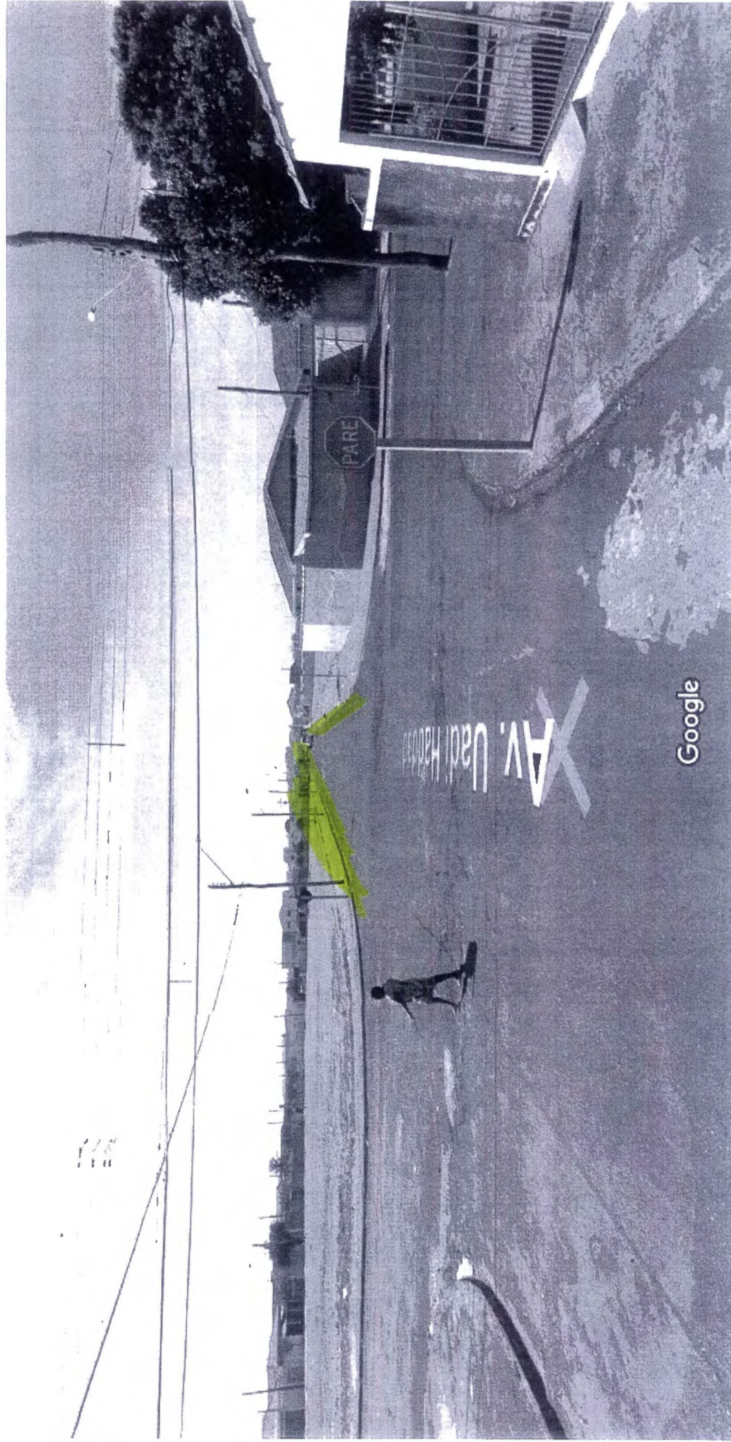
Captura da imagem: ago 2011