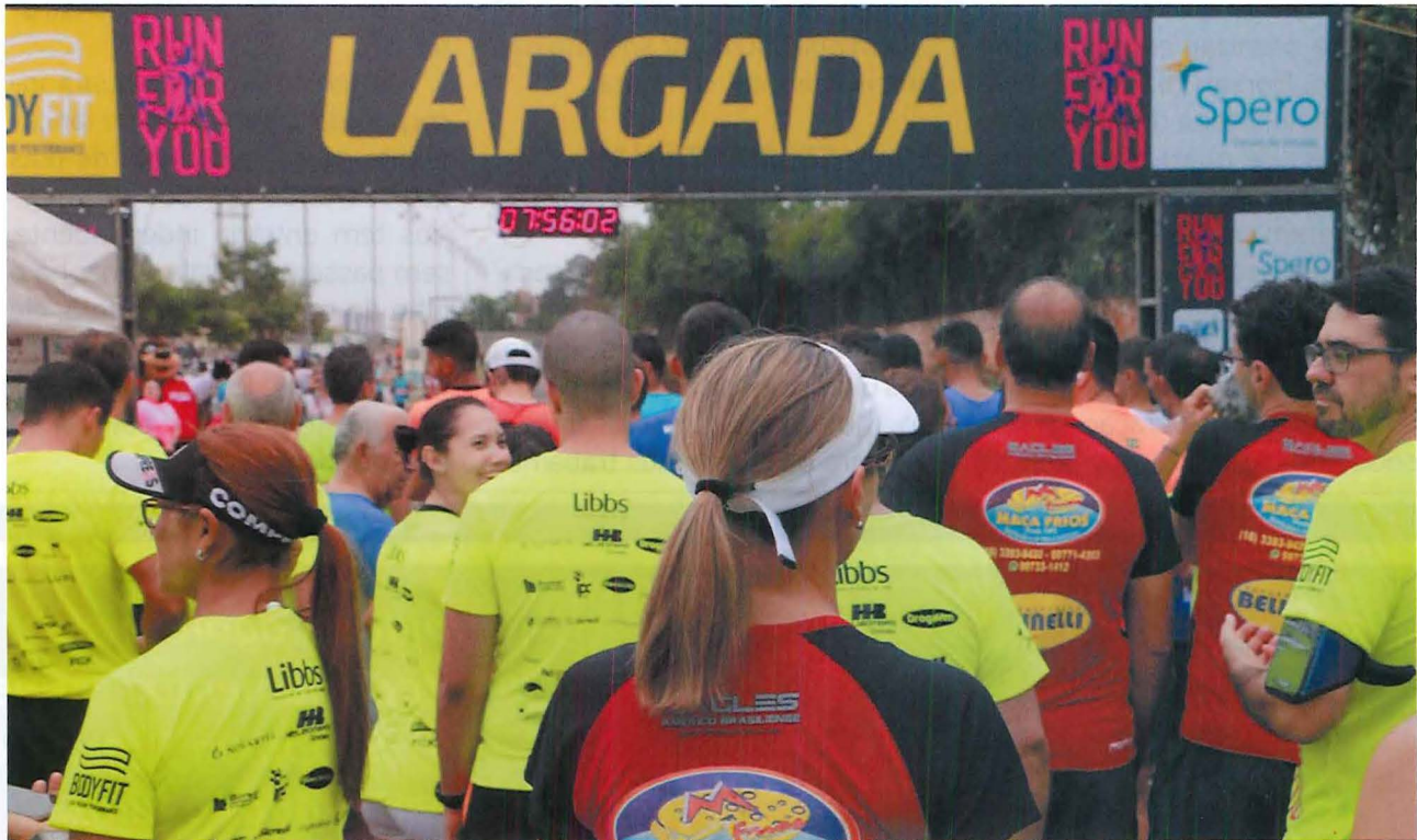
Manhã de domingo, 30 de setembro, centenas de pessoas se preparam para a largada da “Corrida contra o Câncer”

Evento superou as expectativas dos organizadores, que já planejam edição 2019