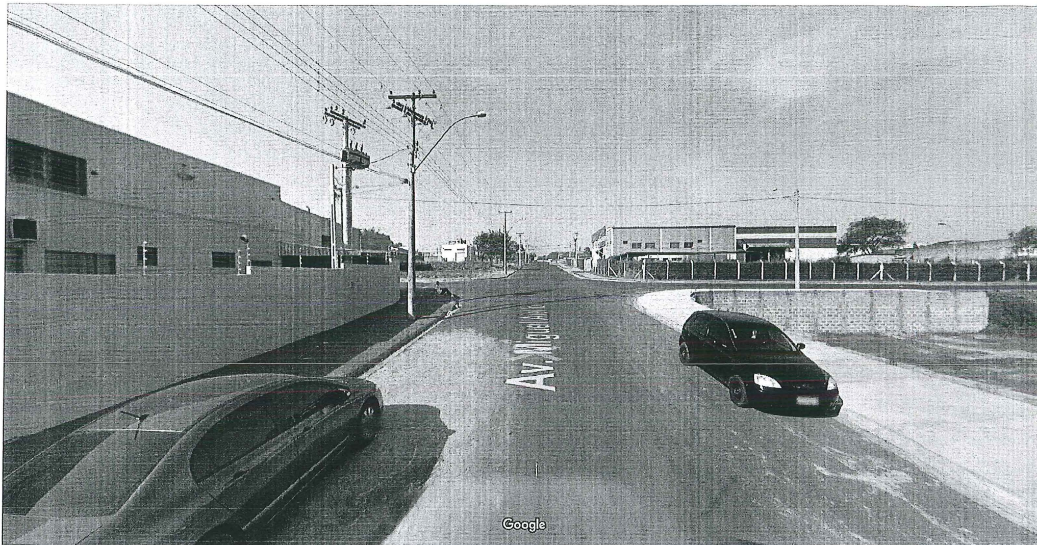
Captura da imagem: ago 2011 © 2018 Google