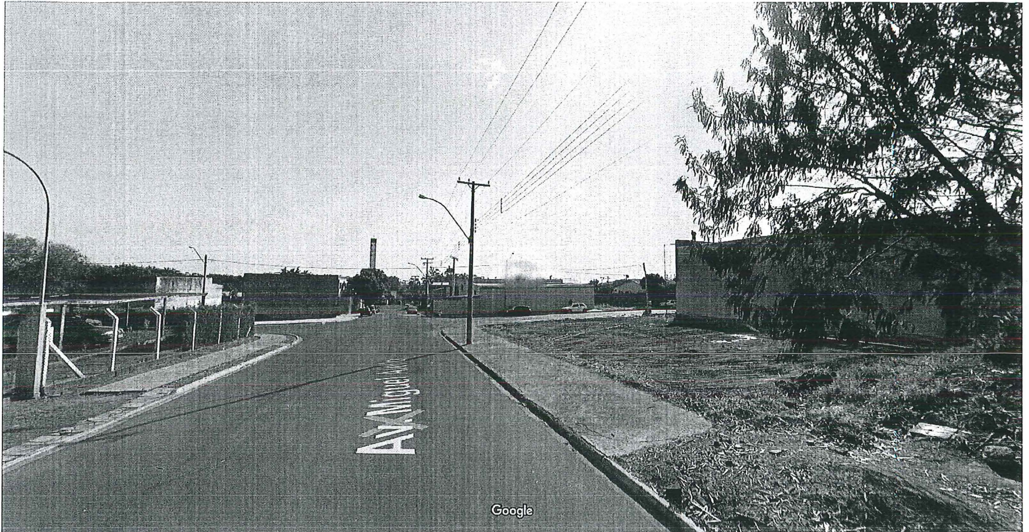
Captura da imagem: ago 2011