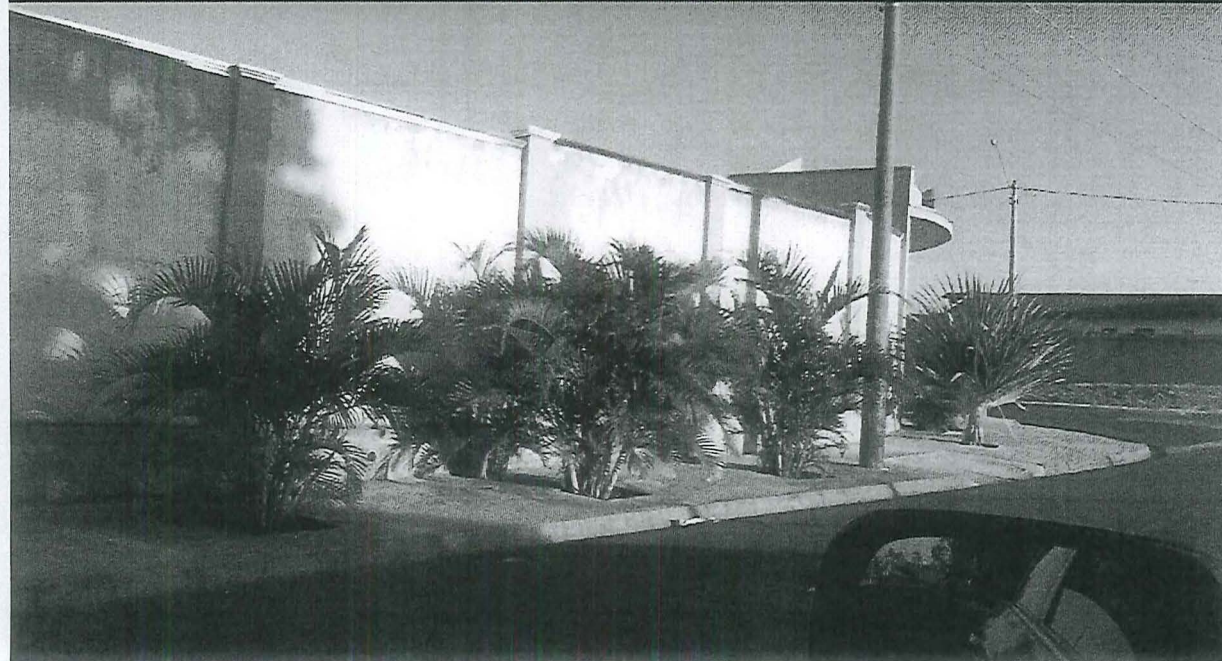
Ind. 021 - 08 Obstrução Calçada Cidade Jardim