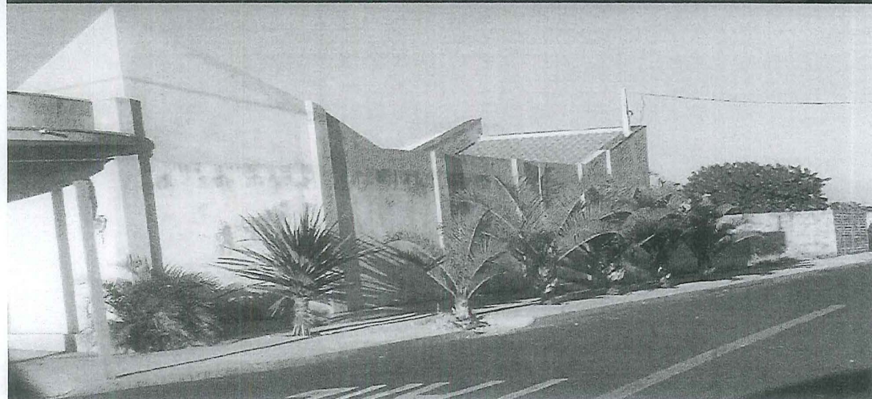
Ind. 021 - 08 Obstrução Calçada Cidade Jardim