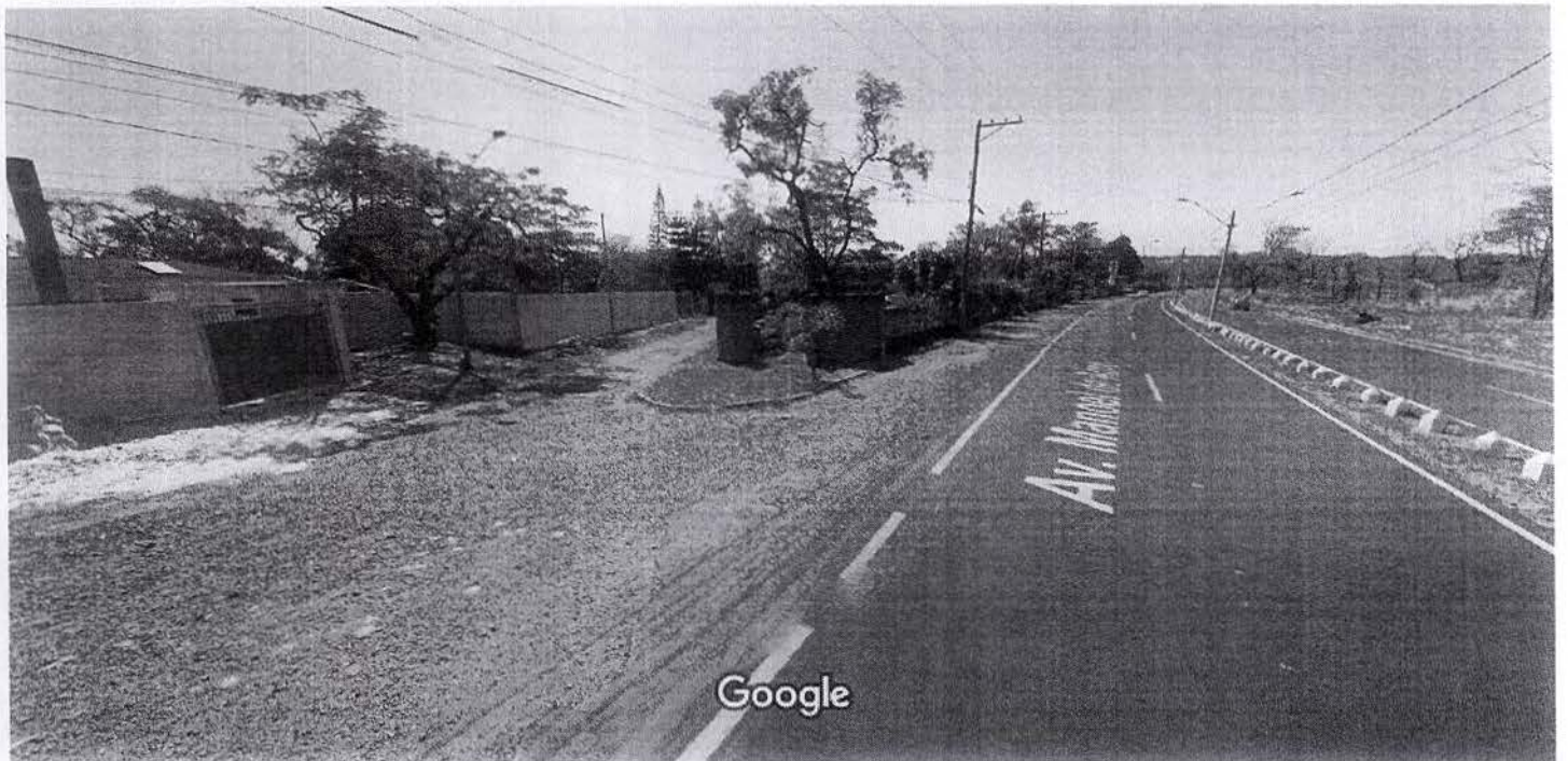
Captura da imagem: ago 2011