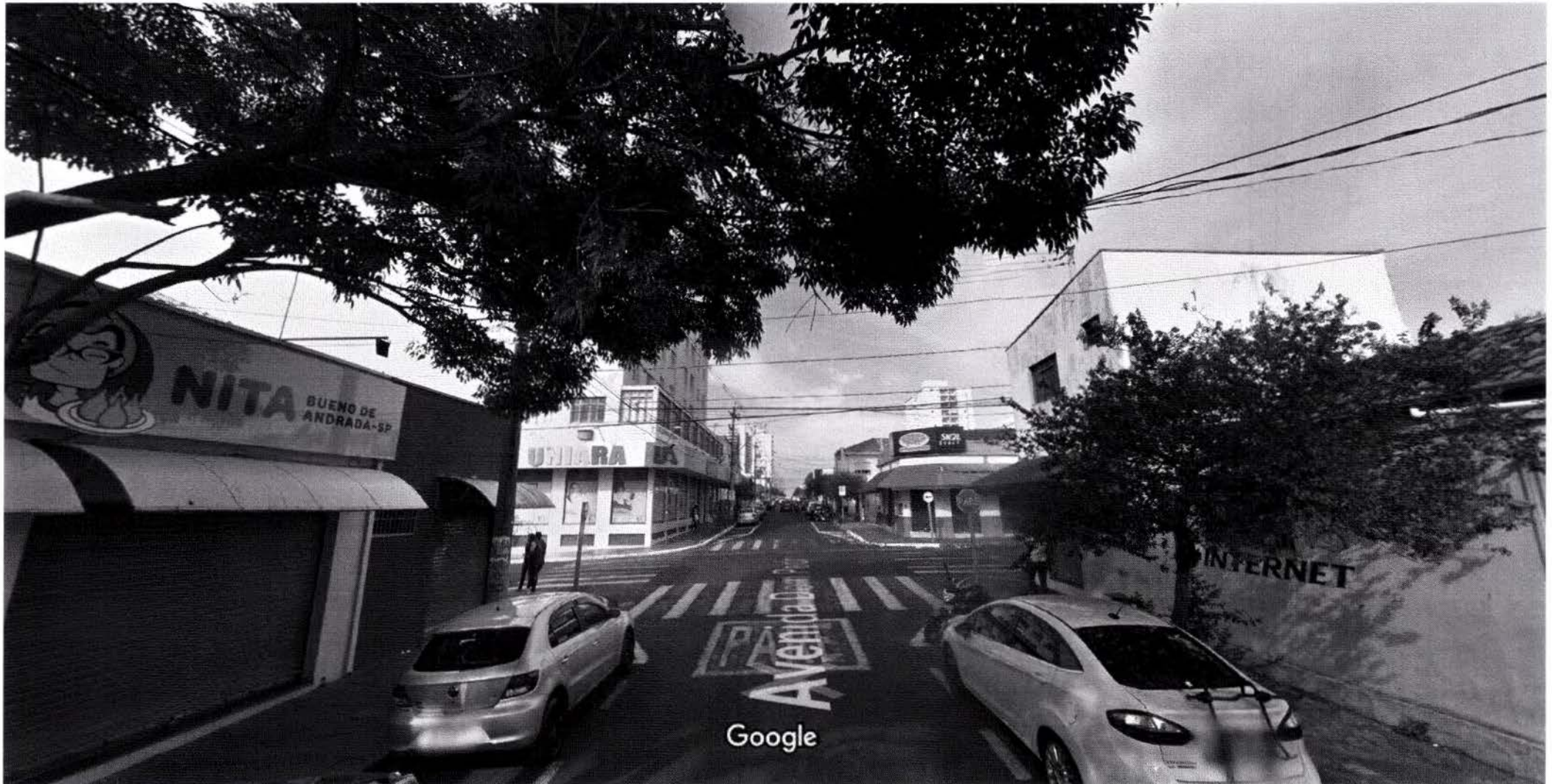
Captura da imagem: dez 2017