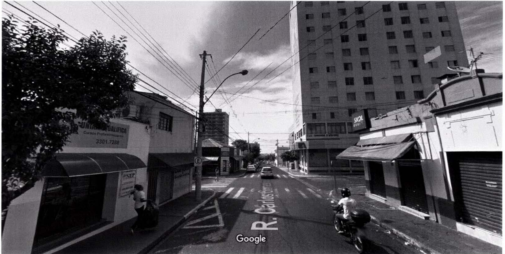
Captura da imagem: dez 2017