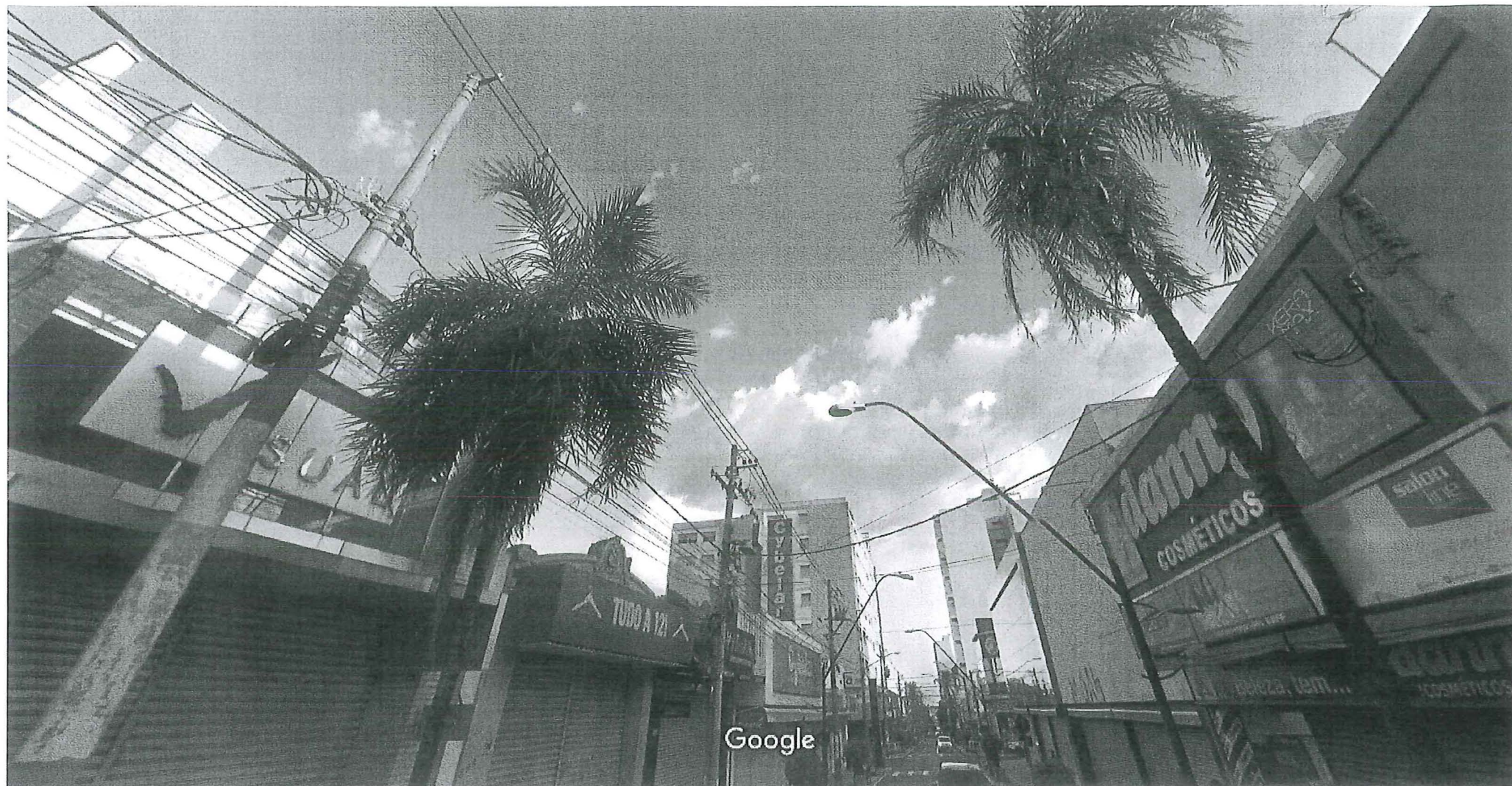
Captura da imagem: fev 2017