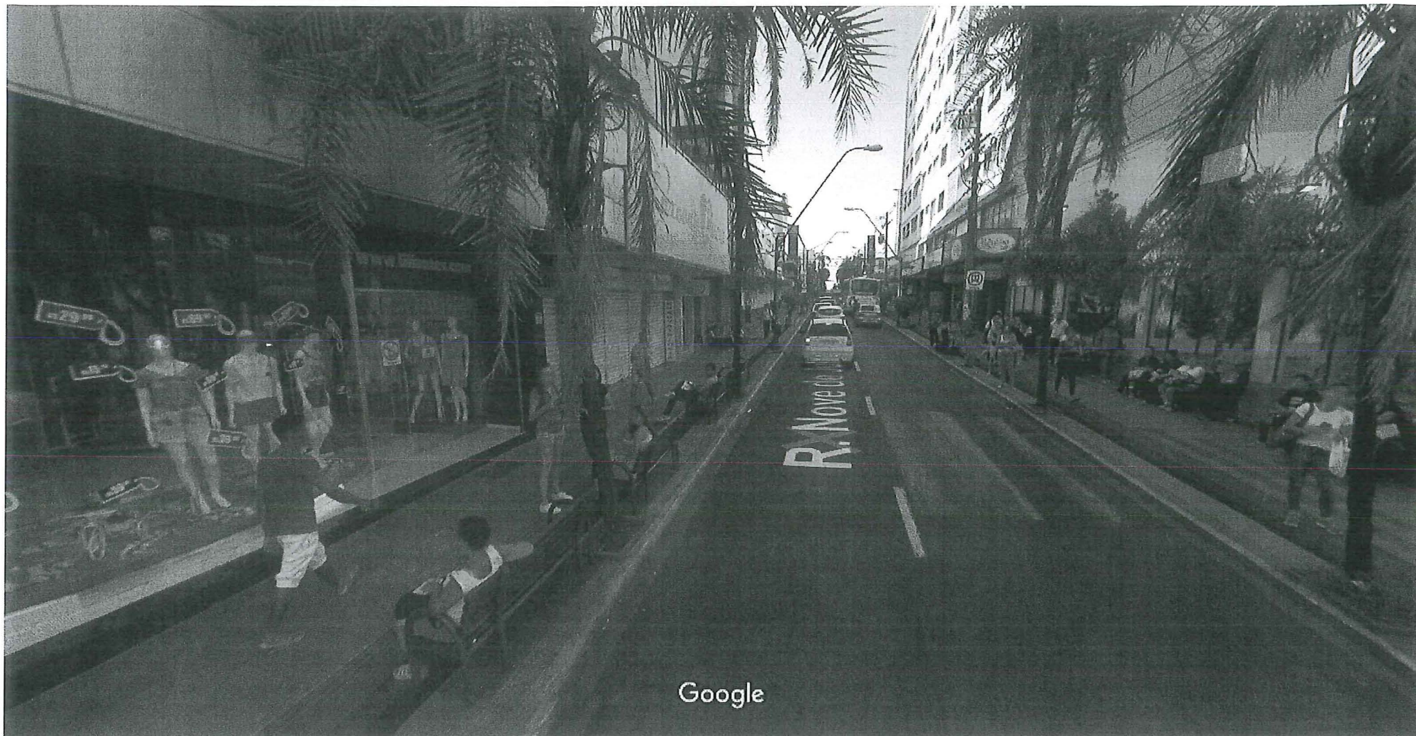
Captura da imagem: fev 2017