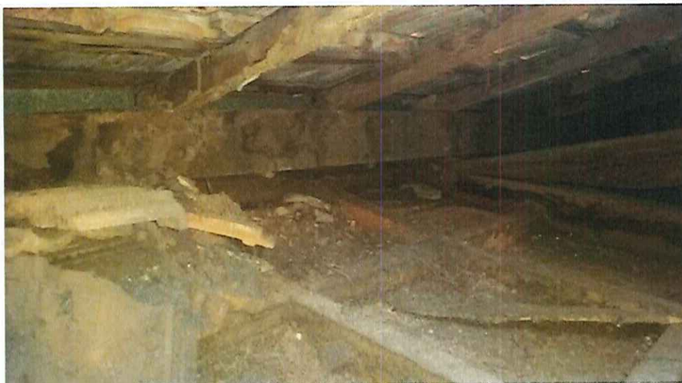
Foto 9: Estrutura de madeira deteriorada por ataque de animais xilófagos e umidade