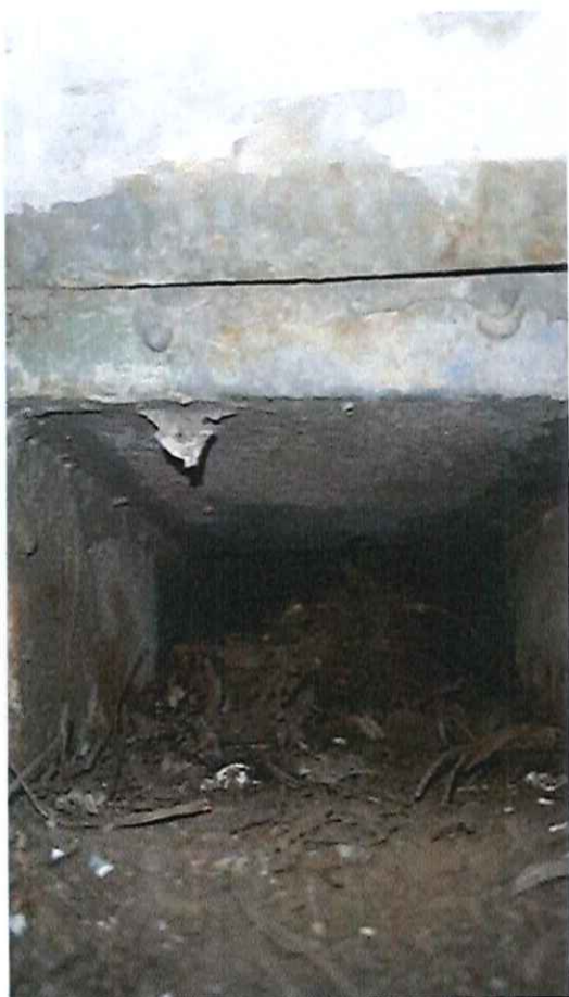
Foto 5 - Bocal de condutor - vista interna

Na foto 04 identifica-se a necessidade de limpeza das calhas e a substituição de calhas mais danificadas, conforme inspeção da Secretaria Municipal de Obras Públicas.