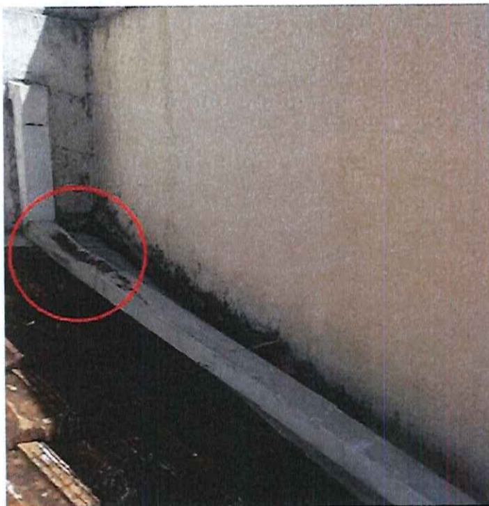
Foto 2 - Estreitamento do condutor

O rufo de encosto encontra-se amassado e oxidado, apresentando perda de eficiência funcional devido ao deslizamento das telhas a ele contíguas (Foto 6)