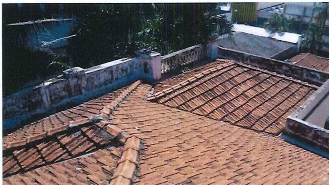
Foto 13: deteriorização do revestimento interno (argamassa) das platibandas.

Observou-se ainda o deslocamento estrutural nas platibanda devido ao desenvolvimento de espécies vegetais (fotos 16 e 17)