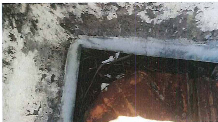
Foto 3 - Calha/bocal de condutor

Na foto seguinte haverá substituição do condutor danificado.