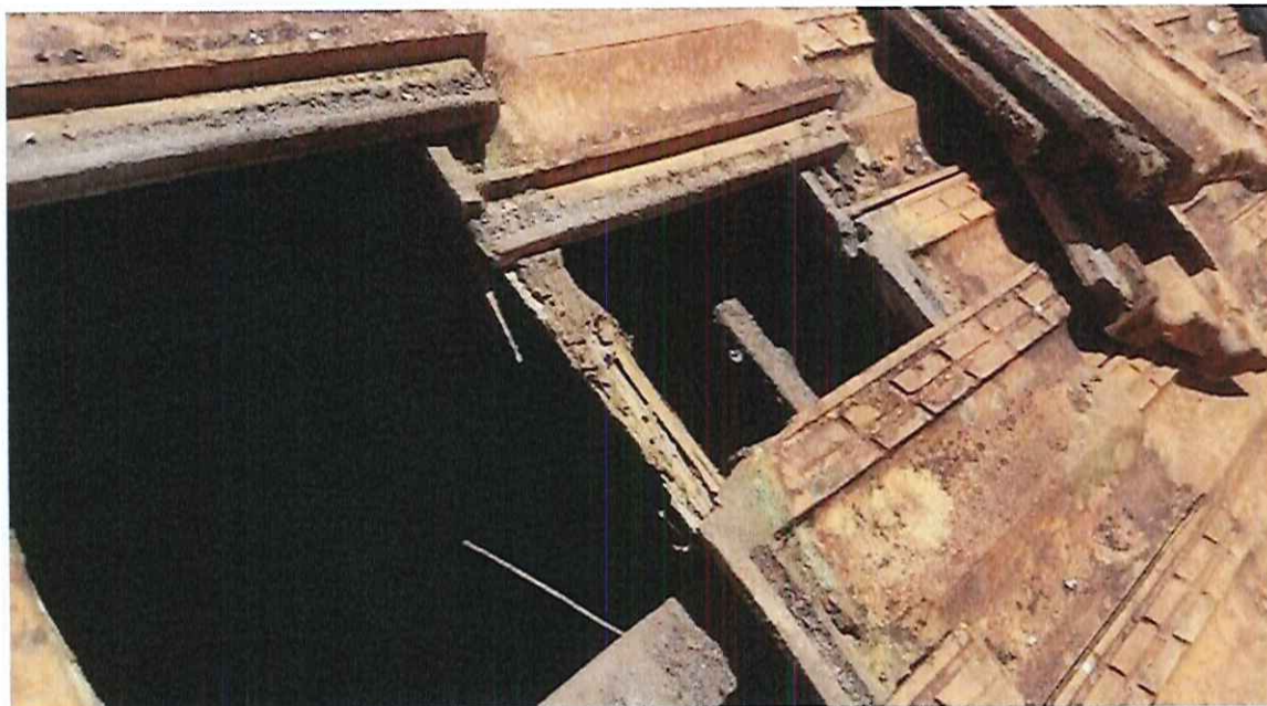
Foto 7 - Colapso do ripamento decorrente do ataque de cupins

Há ripamento que colapsou o que acarretou em escoamento direto das águas pluviais sobre o forro de estuque.