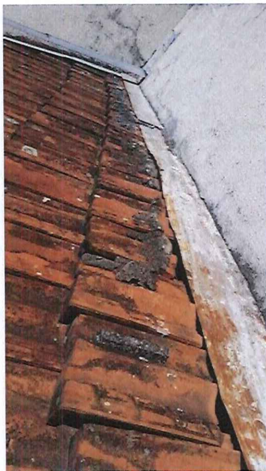
Foto 6 - Rufo de encosto degradado