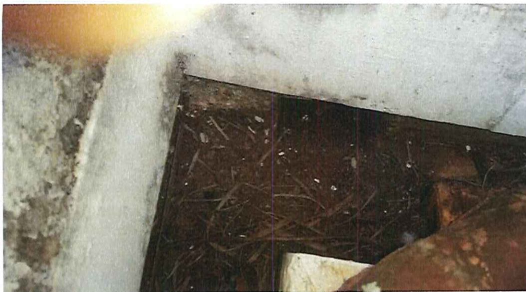
Foto 4 - Calha/bocal de condutor

Na foto 04 identifica-se a necessidade de limpeza das calhas e a substituição de calhas mais danificadas, conforme inspeção da Secretaria Municipal de Obras Públicas.