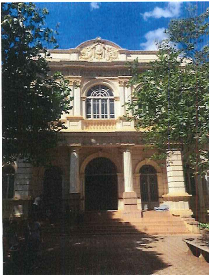
Foto 01 - da fachada principal – Rua São Bento.

Tanto no relatório Fotográfico quanto nas pranchas de projeto arquitetônico há a apresentação da fachada para identificação e apresentação das condições físicas do prédio. Neste momento não há solicitação de manutenção da fachada. A platibanda encontra-se em perfeito estado de conservação.