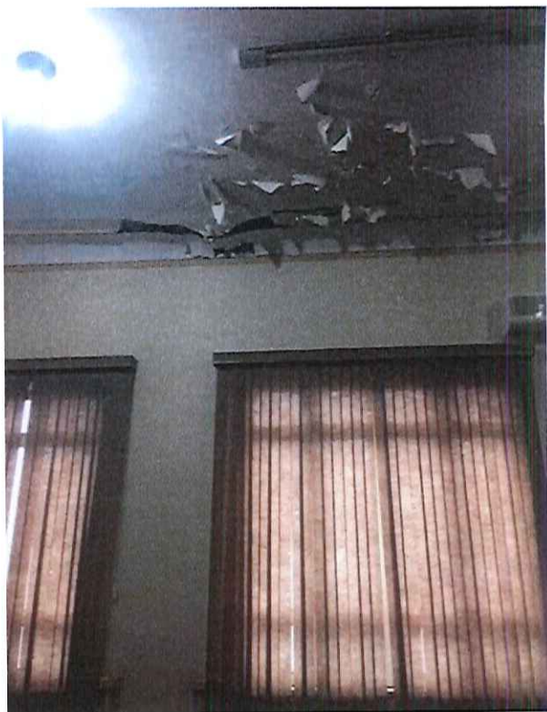
Foto 18: Mezzanino - sala onde nota-se a deterioração do forro (estruque) e eminência de colapso.