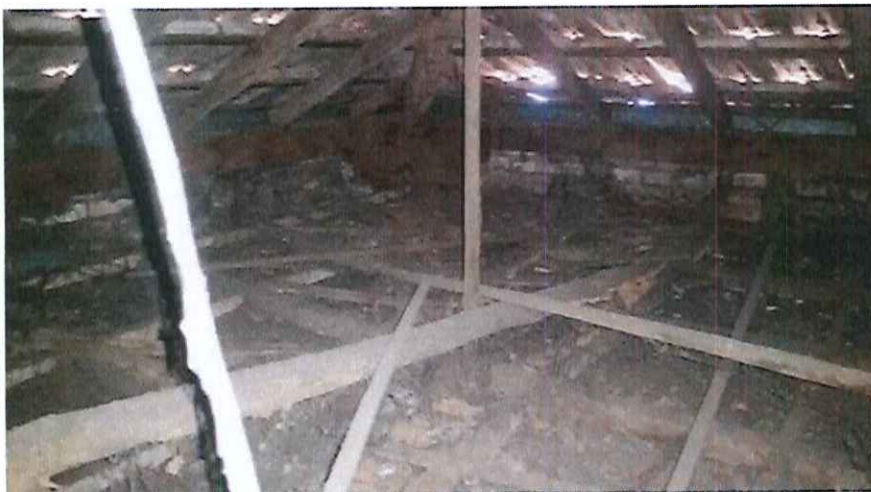
Foto 11: Colapso parcial do madeiramento. Duas tesouras centrais deverão ser reforçadas as demais estão em perfeitas condições. (Obs. Estão demarcadas no projeto arquitetônico)