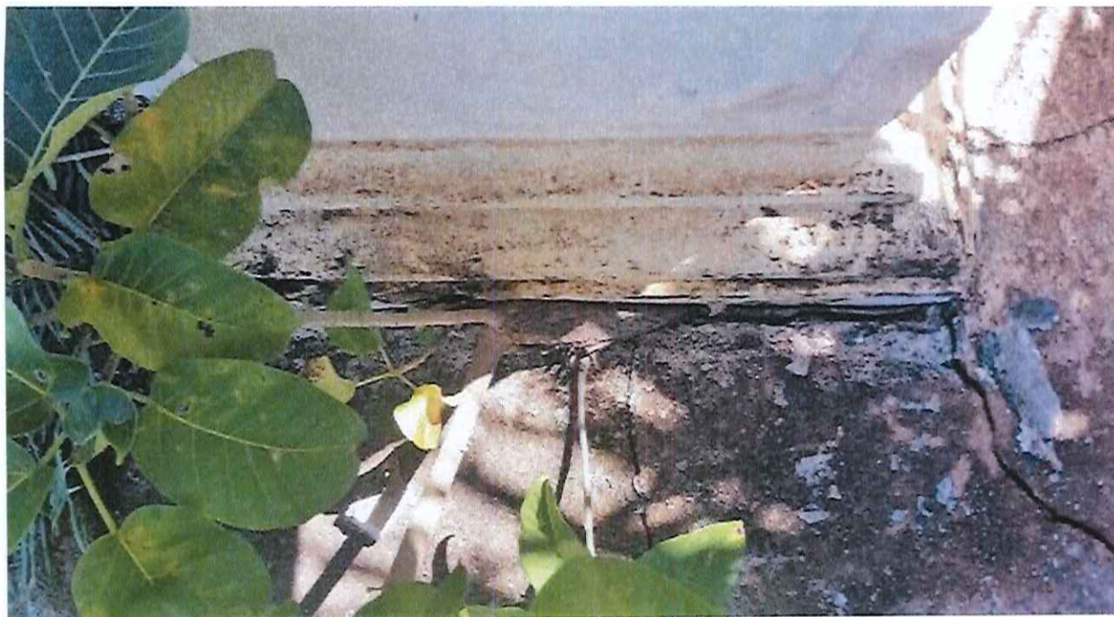
Foto 16: Vegetação nas fendas da platibanda – lateral (Av. Portugal), deverá ser retirada.