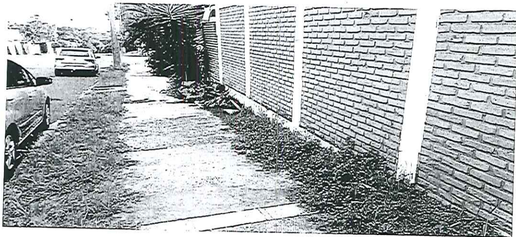
1 - 26.04 - Limpeza calçada - CAPS II - Jardim Primavera