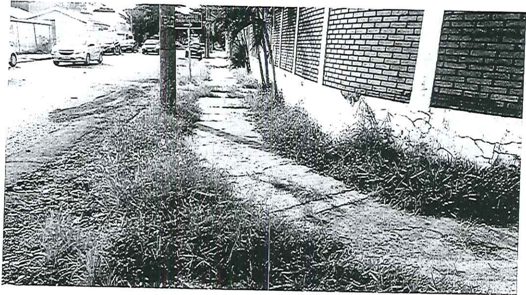
Anexo 1 - 26.04 - Limpeza calçada - CAPS II - Jardim Primavera